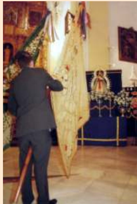
Virgen de la Cabeza

Esta fotografía refleja una de las imágenes más antiguas que guardamos de Ntra. Sra. De Belén. Muestra un antiguo Altar de Cultos que se montaba en la Parroquia de La Asunción cuando bajaba la Virgen. Observamos detalles como son el Templete antiguo de La Asunción, antes de la instalación del actual retablo -que data de la década de los sesenta-; el grandioso manto, la altura. Otro detalle son los angelitos superiores del frontal, que parecen que sostienen el dosel, y sobre todo el gran trabajo de la instalación de dicho Altar, suponemos que para todo el evento de la Novena, y su estancia posterior, que por entonces era de dos meses, pues no iba a residir a San Francisco. Regresaba siempre a Belén un domingo por la mañana, tras la Misa de Doce. (Recuerdos de un viejo monaguillo).