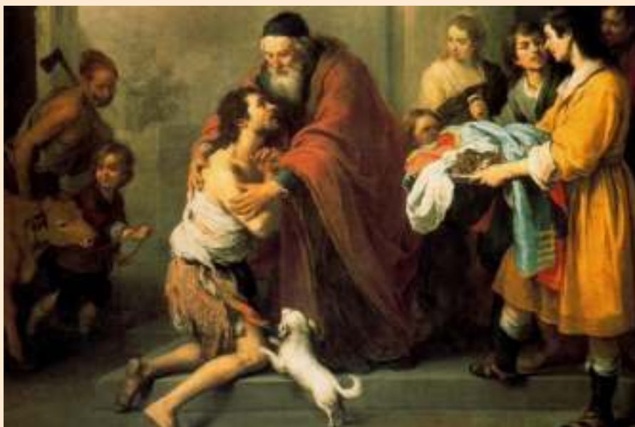
El Regreso del Hijo Pródigo (Murillo, 1668). National Gallery of Art -Washington (EEUU)

La Crucifixión (Luc. 23, 34): La exigencia de Jesús hacia nosotros llega hasta el extremo cuan-