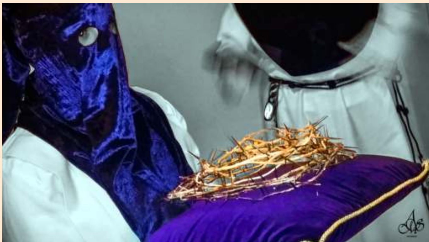
Corona de nuestro Señor portada por una hermana nazareno de la Hermandad (Año 2014)

Santísimo Cristo de las Aguas, fuente de la Divina Misericordia