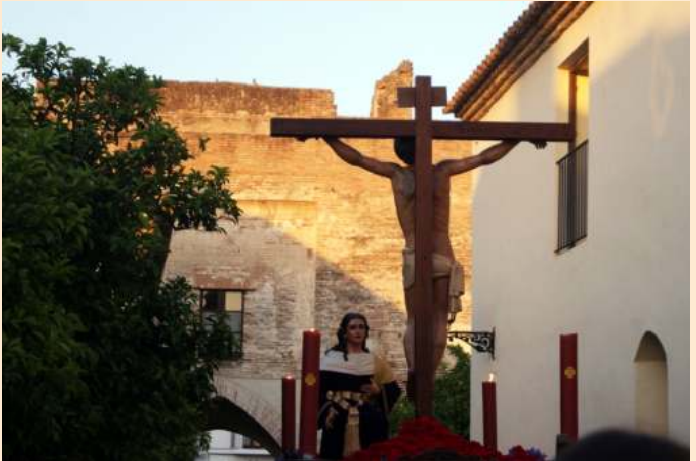
Santísimo Cristo de la Expiración y Santa M a Magdalena