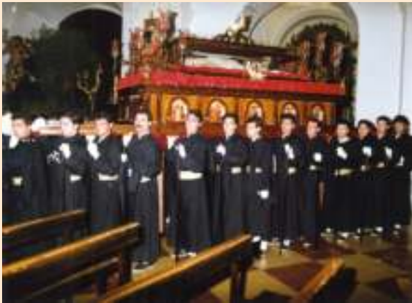
Viernes Santo 1992. Portadores del Cristo.