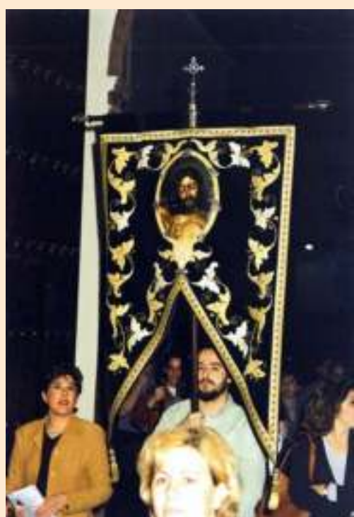
Estandarte de la Hdad. del Cristo de las Aguas en el Año Jubilar