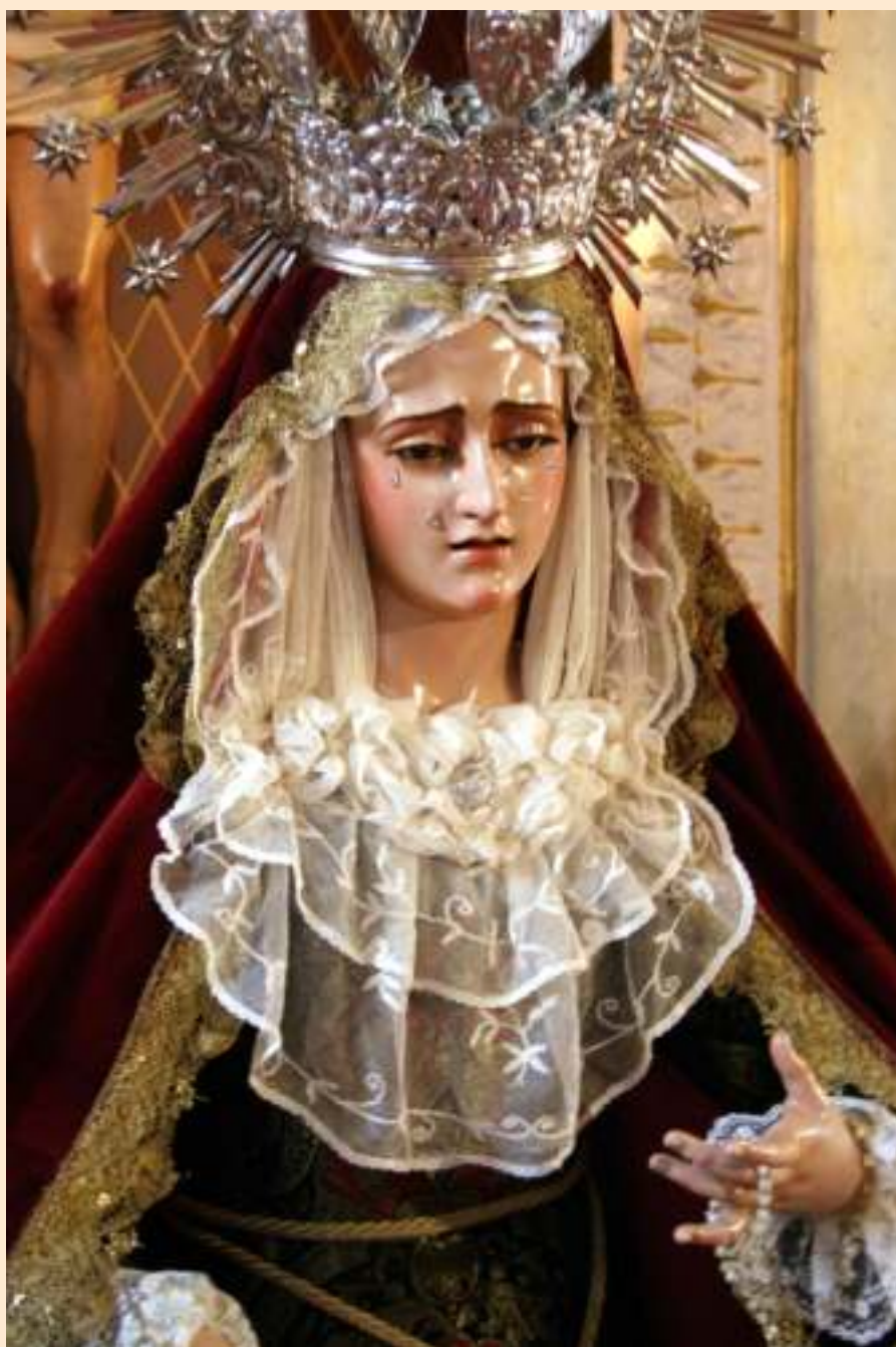
Besamanos a María Santísima de los Dolores.

Hermanos, se acerca un tiempo que renueva el alma del cristiano y remueve la tradición de nuestros mayores. Vivámoslo intensamente: es tiempo de planchar el hábito nazareno, de ensayos y preparativos para el acto de Fe que es nuestro desfile procesional; pero, por encima de todo,