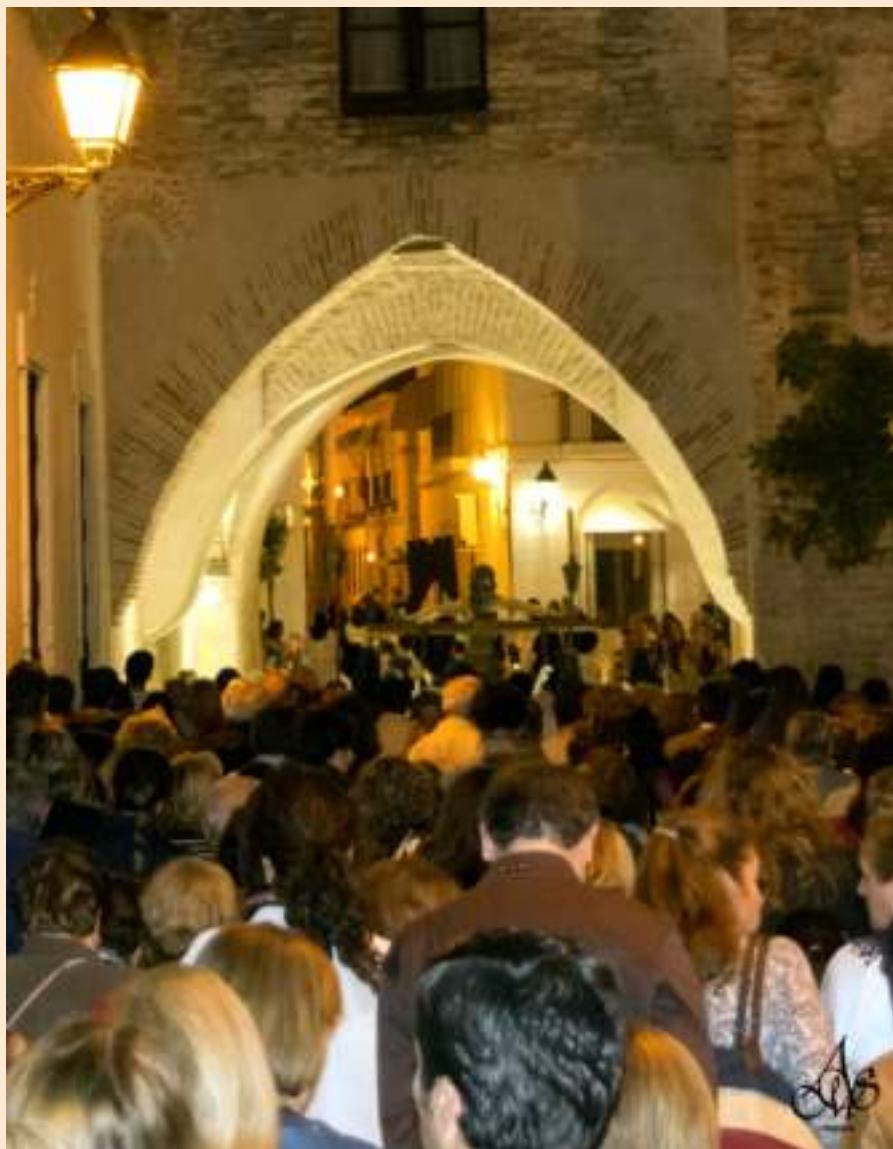
Río de fe, estela de la devoción palmeña (Año 2015)

Nada de extraordinario caracterizará a "Las Aguas" durante este curso, en el que sí celebraremos de una forma especial nuestra Estación de Penitencia el próximo Lunes Santo, nuestra participación en la procesión del Corpus, nuestra Fiesta Solemne en