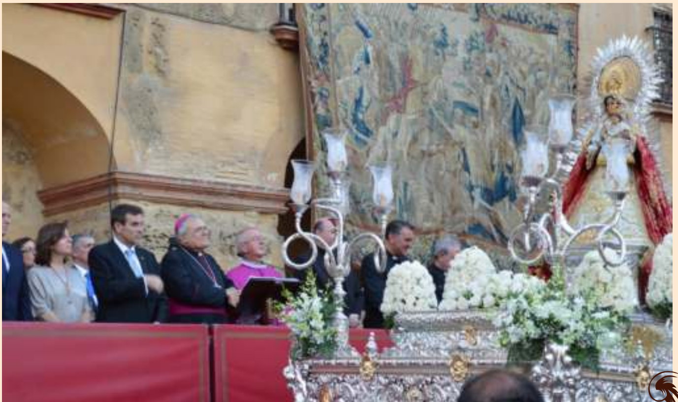
Magna Mariana 2015. La Virgen de Belén ante el Palco de Autoridades junto a la Catedral"