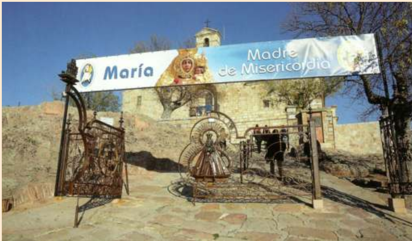
Puerta Santa del Año Jubilar de la Misericordia, Santuario de la Virgen de la Cabeza en Andújar

“Siempre tenemos necesidad de contemplar el misterio de la misericordia. Es fuente de alegría, de serenidad y de paz. Es condición para nuestra salvación. Misericordia: es la palabra que revela el misterio de la Santísima Trinidad. Misericordia: es el acto último y supremo con el cual Dios viene a nuestro encuentro. Misericordia: es la ley fundamental que habita en el corazón de cada persona cuando mira con ojos sinceros al hermano que encuentra en el camino de la vida. Misericordia: es la vía que une Dios y el hombre, porque abre el corazón a la esperanza de ser amados para