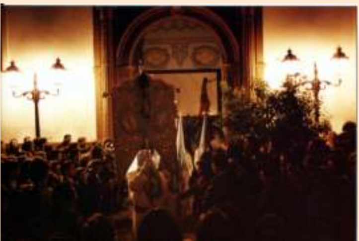
Primera salida de Santo Domingo para la estación de penitencia de la Hdad. del Resucitado, 6:30 de la mañana, del 7 de abril de 1996. →

un año después de ser adquirido por la Hermandad e iba acompañado del paso de Misterio del Señor Orando en el Huerto.