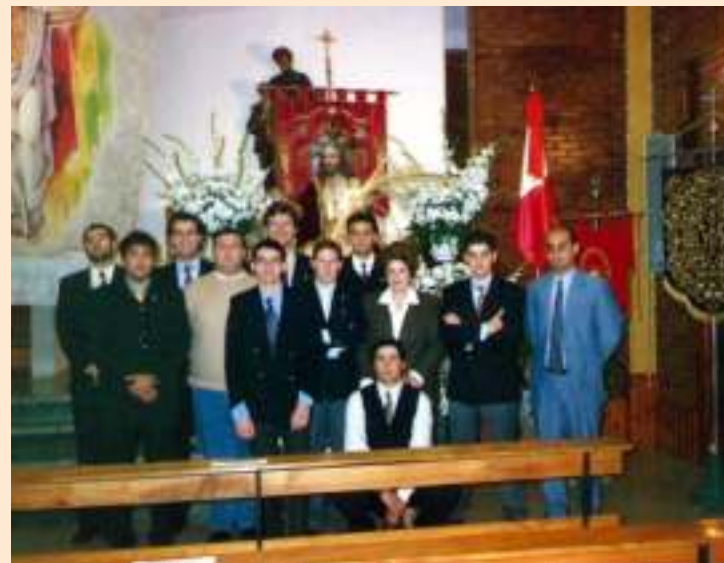
Algunos miembros de la Junta de Gobierno y hermanos de la Hdad. de la Borriquita, año 1997.