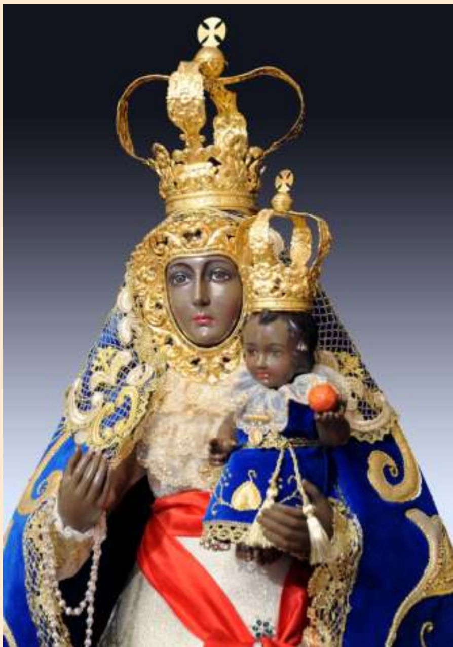
Imagen de la Santísima Virgen de la Cabeza de Palma del Río, Parroquia de la Asunción

Para hacer más importante para nosotros este Año Jubilar tenemos el orgullo y la satisfacción de contar con una Puerta Santa en nuestra Basílica y Real Santuario de la Virgen de la Cabeza, en el Cerro del Cabezo, en Andujar; ese lugar que es meta de nuestras peregrinaciones, que este año serán aún más especiales, ya que al pasar por esa reja