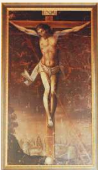
Cristo Crucificado en el Hospital de San Sebastián