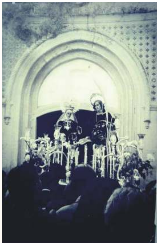
María Santísima de la Piedad y San Juan Evangelista en la década de los 50.