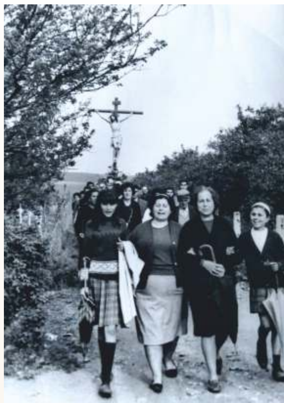
Traslado del Cristo de la Salud de su Parroquia de Pedro Díaz a San Francisco en torno a los años 70.