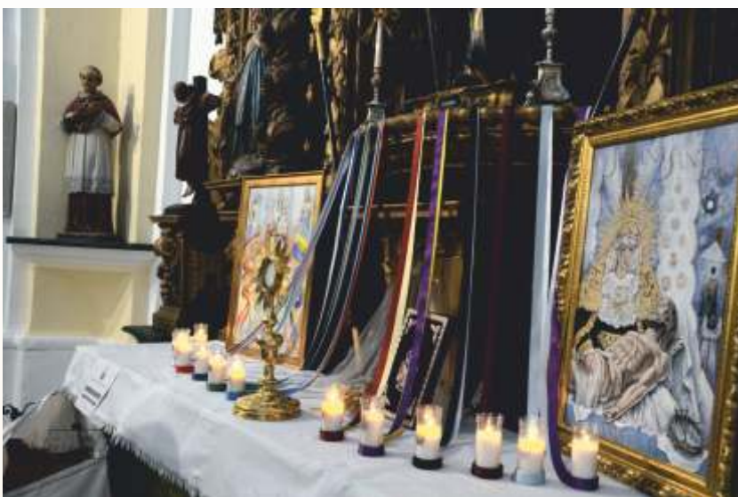
Altar del Consejo de Hermandades en las jornadas del Corpus Christi 2020, celebradas en la Parroquia de la Asunción en honor a Jesús Sacramentado.