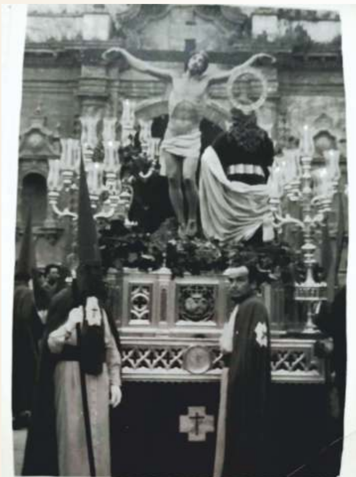
Cristo de la Expiración saliendo de la Parroquia de la Asunción a principios de los años 70.