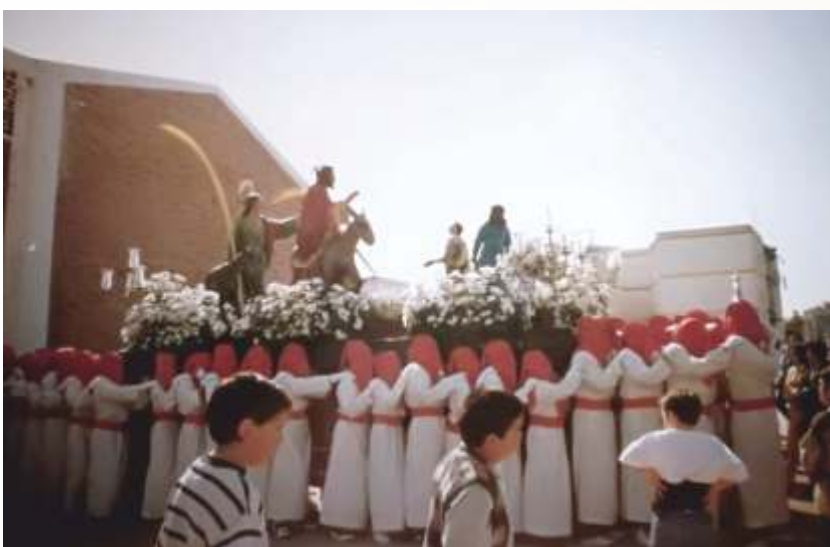
La Hermandad de la Borriquita en la década de los 90 con el paso a portadores.