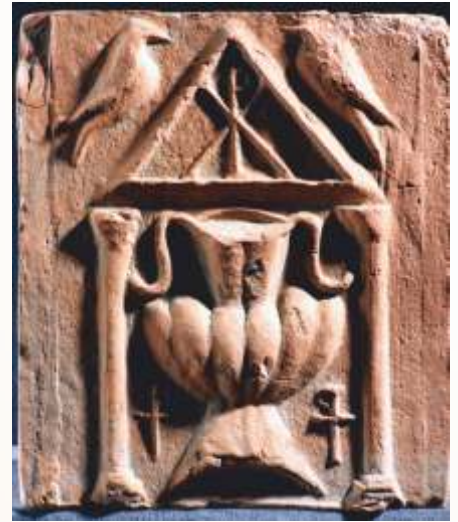
Ladrillo cristiano visigodo. Museo Local.