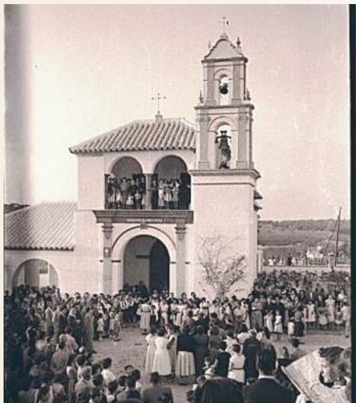
El Santuario en la visita del Obispo Fray Albino en 1954.