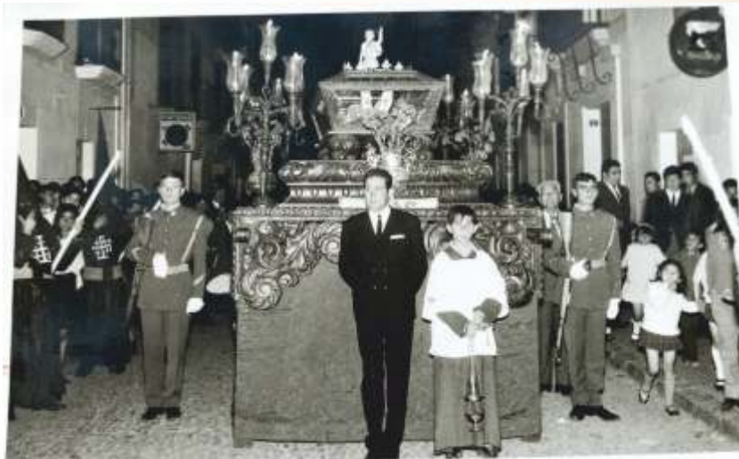
Paso procesional del Santísimo Cristo Yacente en los años 60-70.