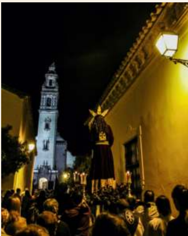
Vía Crucis HHyCC 2019