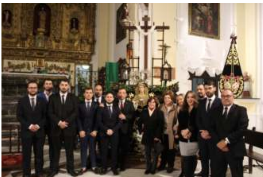
Junta de Gobierno de la Pro-Hermandad de la Soledad

El frío llegó en noviembre y nos regaló a todo Palma otra histórica estampa. En la Parroquia Arciprestal de Nuestra Señora de la Asunción, nace un nuevo gru-