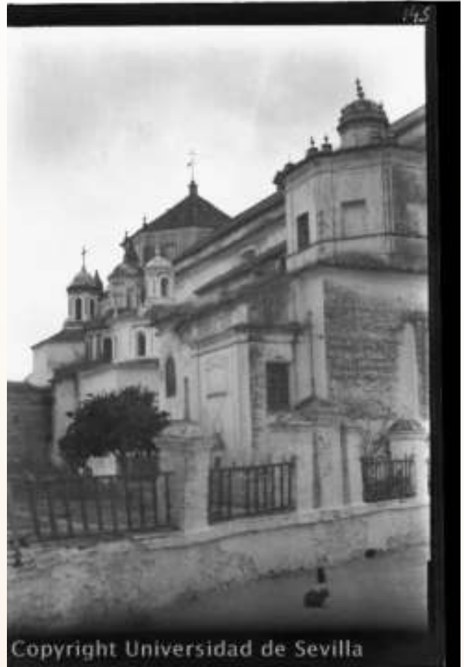
Antiguos muros de la Parroquia de San Francisco