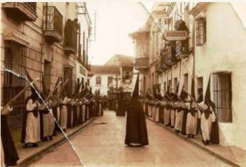
Discurrir del cortejo de la Hermandad de la Expiración en la década de los 60