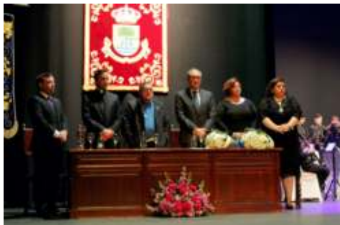
Autoridades civiles y eclesiásticas en el Pregón Mayor de la SS 2019

En cuanto a los actos de este Consejo de Hermandades, debemos destacar los Pregones Juvenil y Mayor de nuestra Semana Santa.