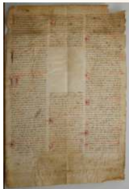
AMPR, Ordenanzas Cofradía de Santa María

Los siglos XIX y XX, con todas sus convulsiones, desdibujaron el mapa cofrade palmeño. Despropósitos y esfuerzos se resolvían en poco espacio de tiempo. La crisis material debió afectar seriamente cuando hemos visto como se encarga un nuevo Santo Sepulcro de plata en 1887 4 . O el esfuerzo reorganizador de 1922 con un verdadero éxito en 1926 5 . La hecatombe religiosa de 1936 y la lenta reorganización de cuatro décadas desde 1937