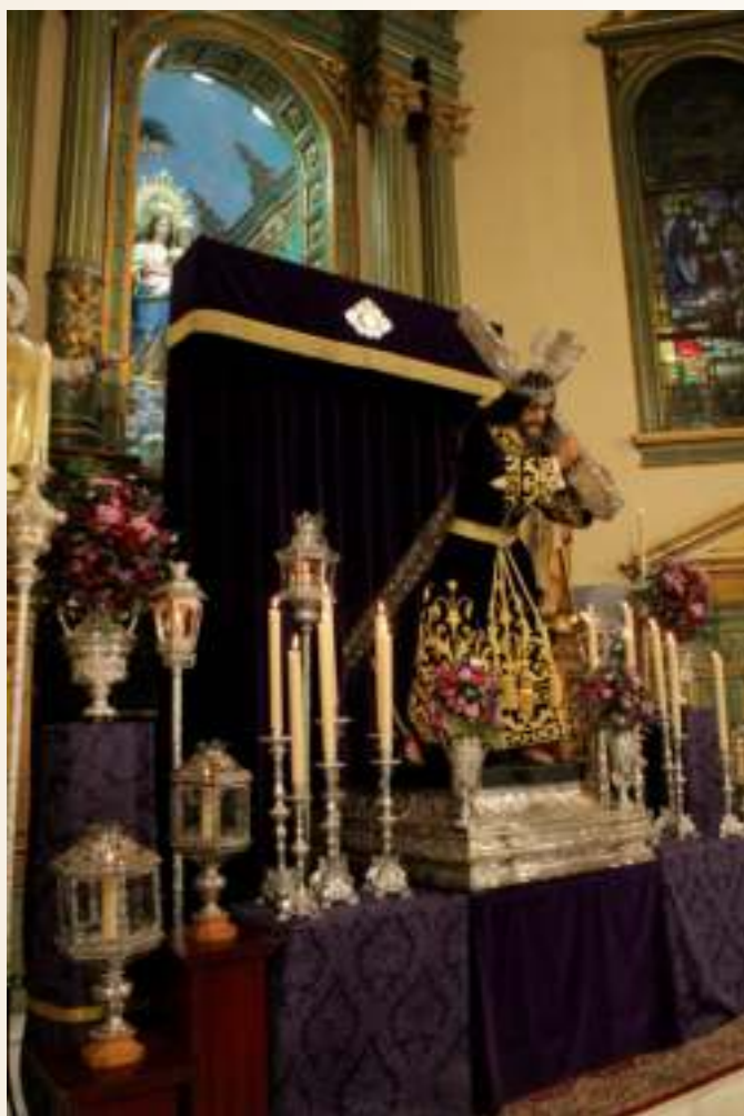
Ntro. Padre Jesús Nazareno en el Santuario de M a Auxiliadora (Córdoba)