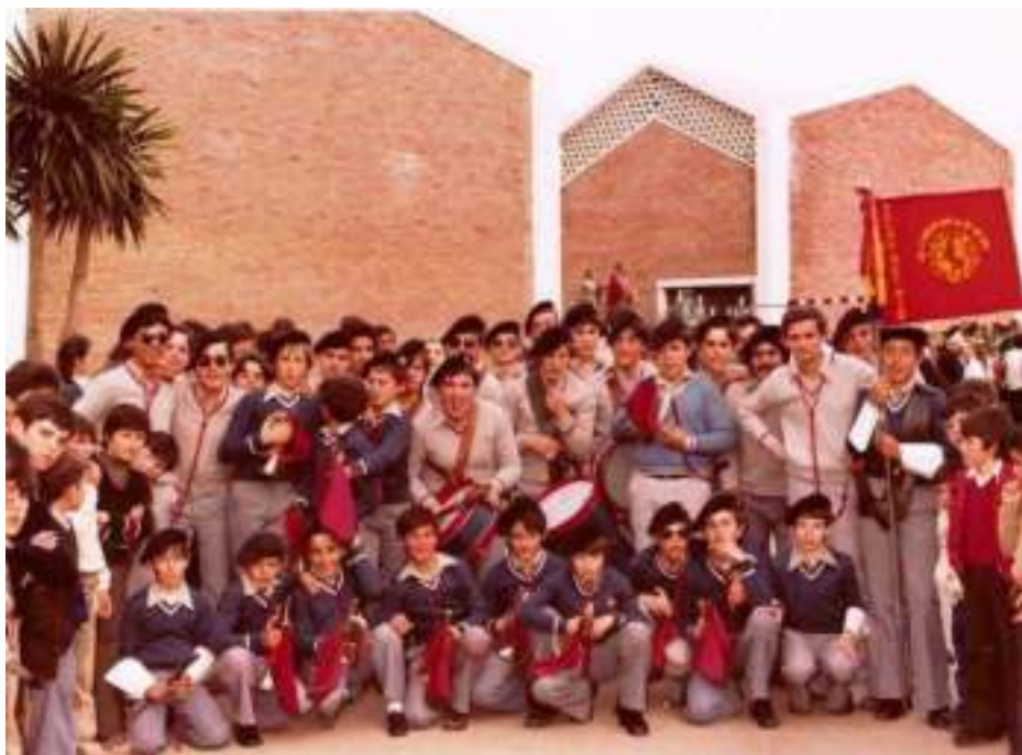
Una de las primeras salidas procesionales de la Hermandad de la Borriquita