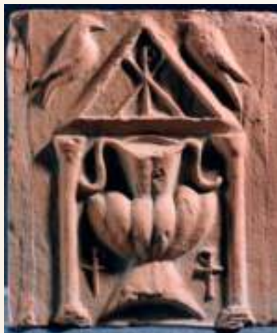
Museo local: Ladrillo visigodo

Archivo Municipal de Palma del Río, Archivo Histórico Provincial de Córdoba, Archivo del Obispado de Córdoba, Archivo de Protocolos Notariales de Posadas, Archivo Arzobispado de Sevilla, Biblioteca y archivo del convento de Ntra. Sra. de Loreto, Espartinas (Sevilla) y documentos que custodian las propias cofradías, libros de actas, inventarios, contratos... Las escasas fuentes secundarias locales, bibliografía contenida en libros, revistas, artículos, tesis... y las fuentes gráficas con la producción fotográfica, grabados, reportajes, prensa junto a documentos personales conservados por generaciones. No es desdeñable la historia oral, el relato y memoria de personas que han vivido y participado directamente en el mundo cofrade, todo lo que permita conectar el pasado con el presente.