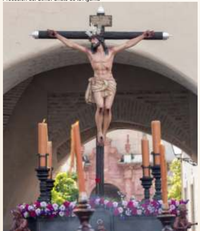
Procesión del Stmo. Cristo de la Agonía

Cada año, el cuarto domingo de Cuaresma, cuando Palma del Río comienza a vivir más intensamente el período de espera para la gran semana, el Cristo de la Agonía sale a la calle desde la Parroquia de la Asunción gracias a su Grupo Parroquial. Antesala de los grandes días que en Palma tendrán lugar estos días.