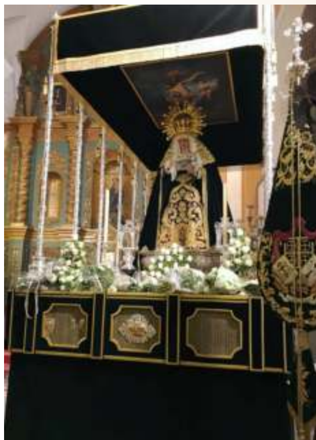
Bendición del palio de María Santísima de los Dolores

El pasado 10 de mayo también será un día para recordar para la historia del Consejo de Hermandades y todo el pueblo, pues se presentaba en el Hospital de San Sebastián el que sería el primer cartel anunciador de las Hermandades de Gloria de nuestra localidad. Se trata de una pintura en acuarela realizada por el cartelista sevillano Daniel Jiménez, y en la que podemos contemplar todas estas imágenes