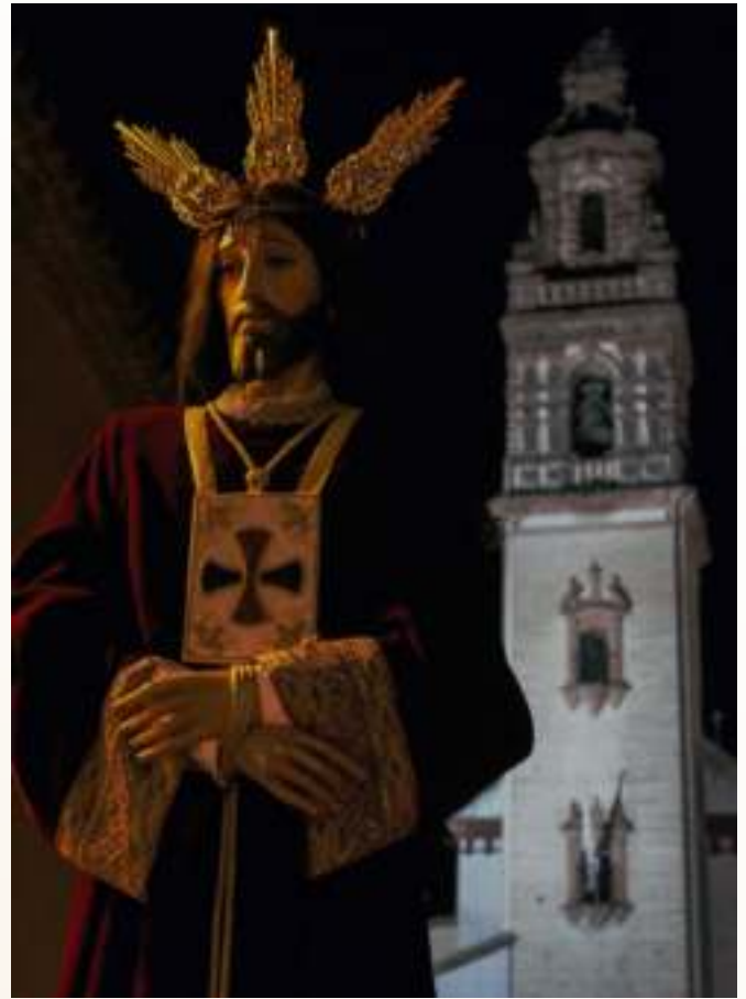
Ntro. Padre Jesús Cautivo saliendo de la Parroquia Ntra. Sra. de la Asunción

En primer lugar, cabría destacar la celebración del primer Vía Crucis del Consejo General de Hermandades y Cofradías, acto que surgió gracias al apoyo de todas y cada una de las Hermandades que conforman este Consejo, bajo la venia de las comunidades parroquiales palmeñas. Este Vía Crucis tiene fijada su celebración el segundo sábado de Cuaresma, para ello, cada año las Hermandades eligen una imagen titular de nuestras Hermandades, para presidir así este acto de unión y oración y hacer juntos un buen camino de preparación, de renovación y profesión de nuestra fe. El pasado año, con motivo de los cincuenta años de la llegada de la imagen de Nuestro Padre Jesús Cautivo, titular de la Hermandad del Huerto a Palma del Río, las Hermandades tuvieron a bien designarlo para presidir este primer Vía Crucis del Consejo. Este año 2020, será el turno del Santísimo Cristo Yacente del Santo Sepulcro.