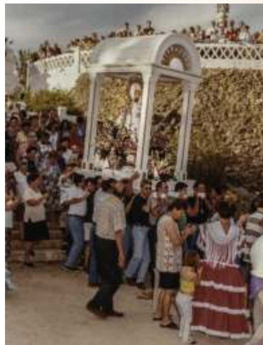
Romería de nuestra patrona, años 80