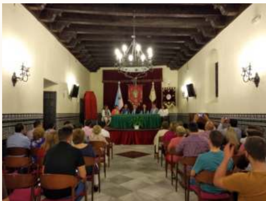
Acto de presentación y Cartel de Glorias 2019

La época estival del pasado curso, pasó de una manera atípica, pues en las entrañas de nuestro pueblo, en su historia más profunda y tan emblemático rincón para todos los palmeños, y por supuesto para los cofrades, en el Hospital de San Sebastián, allí donde en una centenaria Capilla Jesús Nazareno recibe las oraciones y súplicas de todos sus hijos. Nuestro Obispo de Córdoba, quería que la imagen de Nuestro Padre Jesús Nazareno estuviera presen-