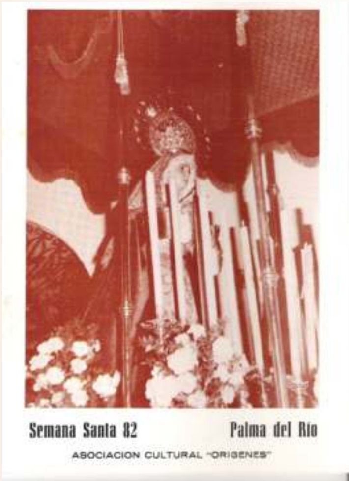
Cartel Semana Santa 1982