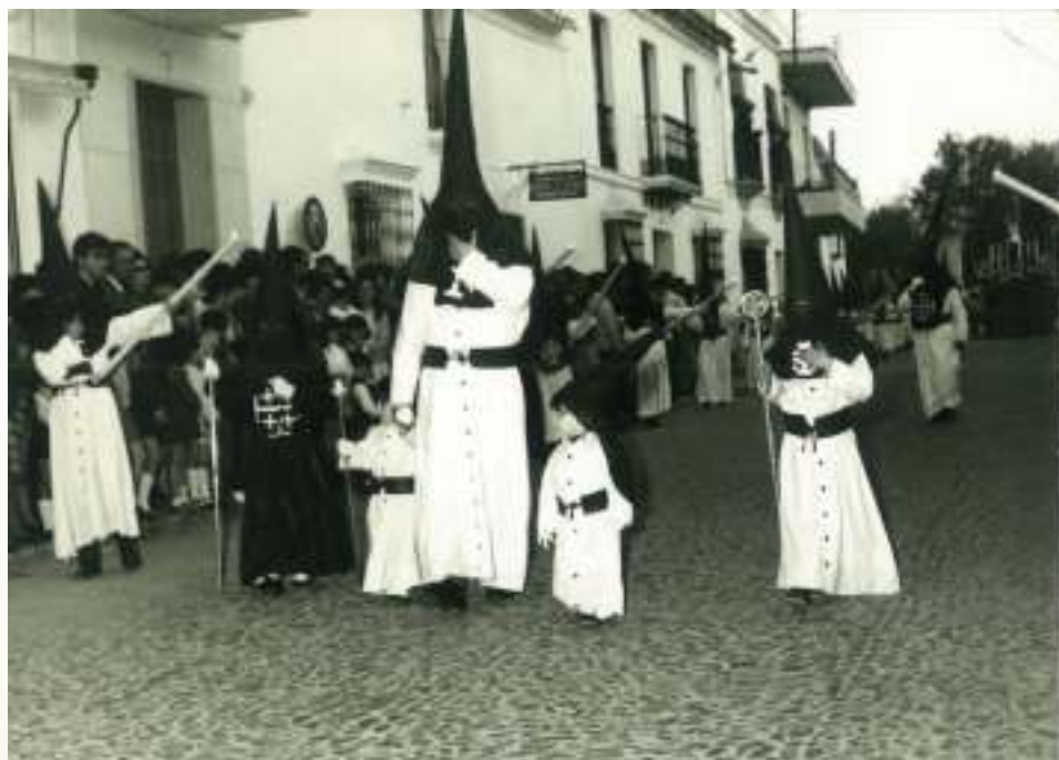
Discurrir del cortejo procesional del Viernes Santo en la década de los 80

Cuaderno de Novena de 1945, en el que podemos contemplar a la Virgen de las Angustias y a nuestra patrona la Virgen de Belén