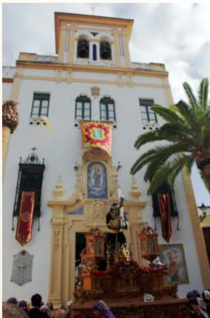
Ntro. Padre Jesús Nazareno en la procesión Magna de Córdoba

su paso procesional para recorrer las calles de Córdoba el 14 de septiembre, solemnidad de la Exaltación de la Santa Cruz, camino de la Santa Iglesia