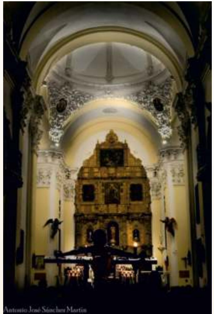
Estación de Penitencia ante el sagrario del la Asunción.

Esta pequeña hermandad no pretende por tanto ser madre y maestra de nada, pero sí quiere tener claro cuál fue el motivo por el que se fundó, el carisma que la envuelve y rellenar ese gran vacío que suponía estar huérfanos de la figura de María representa-