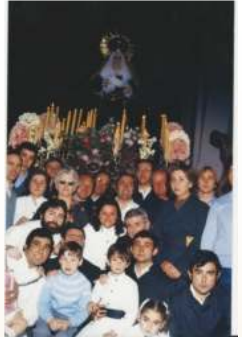
Virgen de los Dolores