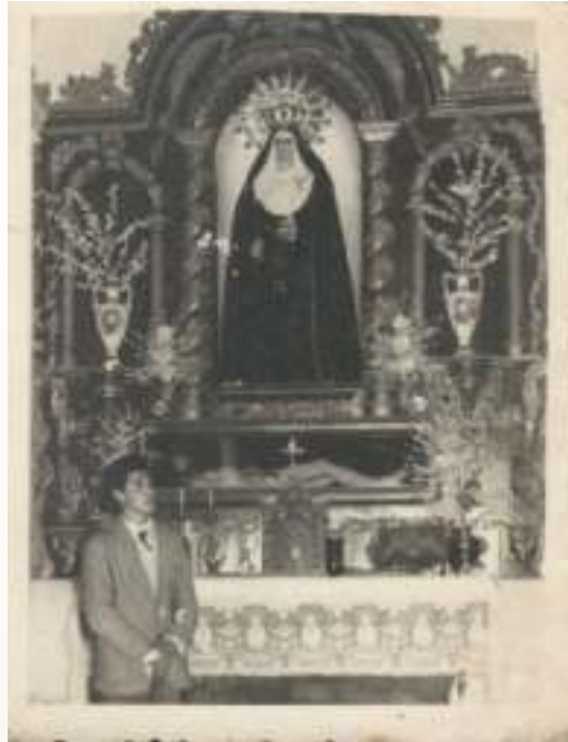
Virgen de los Dolores