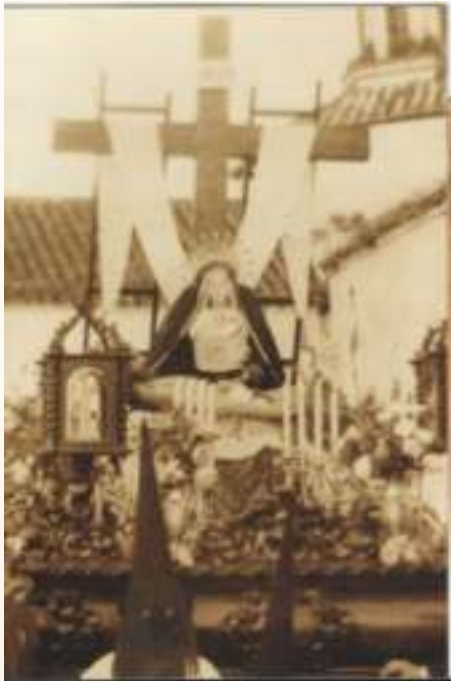
Procesión de las Angustias en 1962