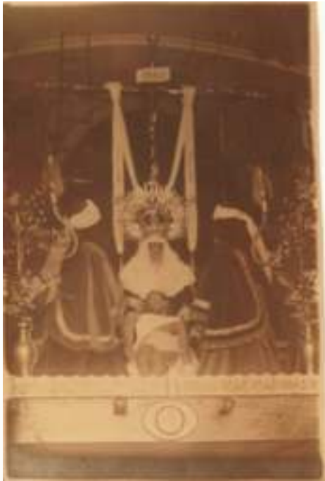
Paso de las Angustias, anterior a 1936