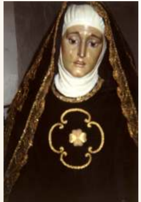
M a Stma. de la Piedad, año 1990