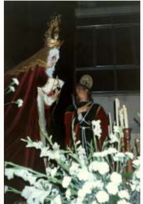
M a Stma de los Dolores y San Juan Evangelista, año 1990