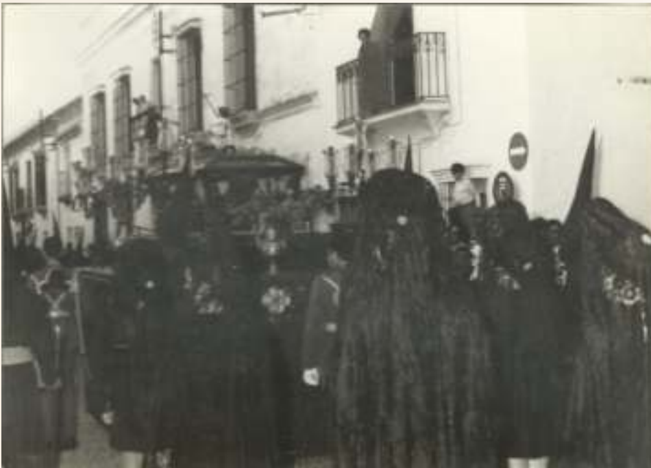
Procesión del Santo Sepulcro, 31 de marzo de 1972