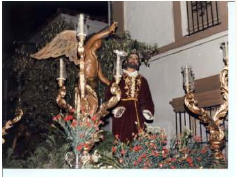
La Oración en el Huerto, año 1990