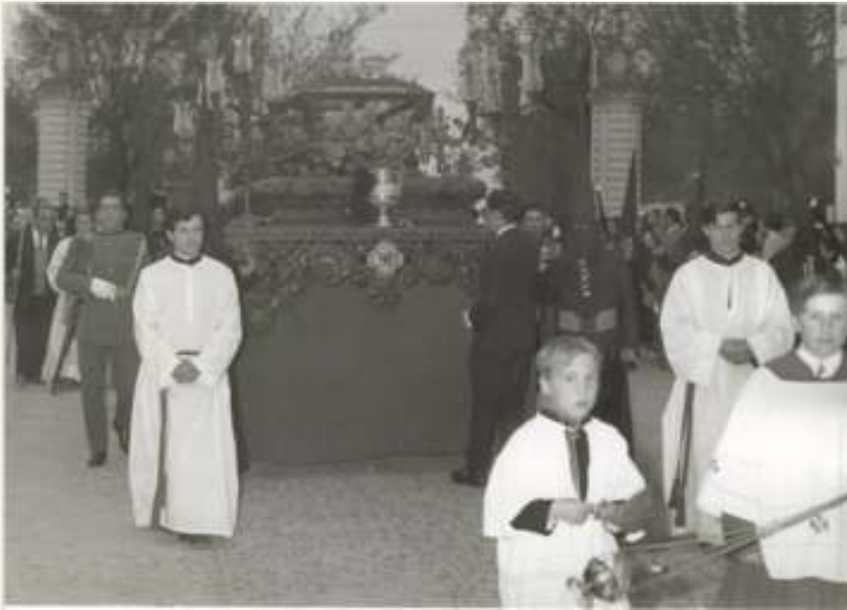
Procesión del Santo Sepulcro, comienzos de los 70 del siglo pasado