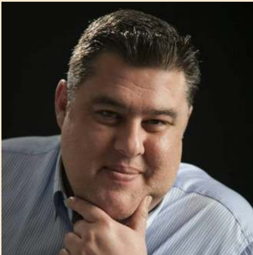
imagen es hermosa, de alguna manera Cristo está presente en ella, pero yo procuro no quedarme ahí. Es como si nos quedáramos mirando la foto de nuestra novia. Hay que desposarse con ella. Y sé que las personas cofrades viven, en su inmensa mayoría, una fe sana, pero creo que lo correcto es siempre dar un paso más hacia Cristo, el siguiente paso es el que importa, pero hay que darlo. La fe es como una planta. Tú no puedes un día embucharla y luego estar dos meses sin regarla, la matas.

La Imagen de Cristo que se encuentra en San Francisco me ha remitido siempre a Nuestro divino Maestro. La