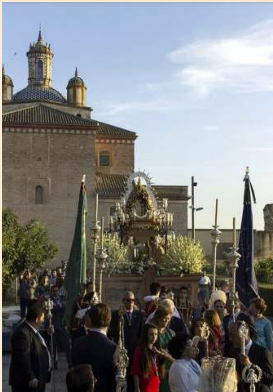
Paso procesional de la Virgen de la Cabeza, a su paso por la alcazaba

Pero todo esto es lo que ha hecho crecer a nuestra Hermandad, y después de ese día 23 de Septiembre, después de quedar patente el apoyo de las demás Cofradías Filiales, la Cofradía Matriz, y la Comunidad Trinitaria del Santuario de Andujar, de todas las personas que salieron a la ca-