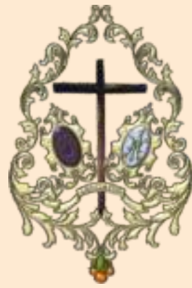
Grupo Parroquial "La Agonía"