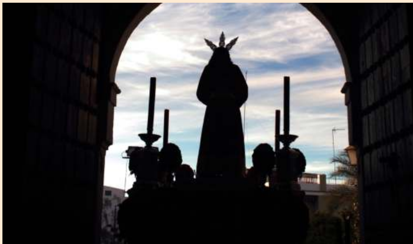
Nuestro Padre Jesús Cautivo saliendo de su templo para ver a sus hijos

Una Hermandad, es trabajar todo un año dentro y fuera de la Parroquia, porque hay que estar