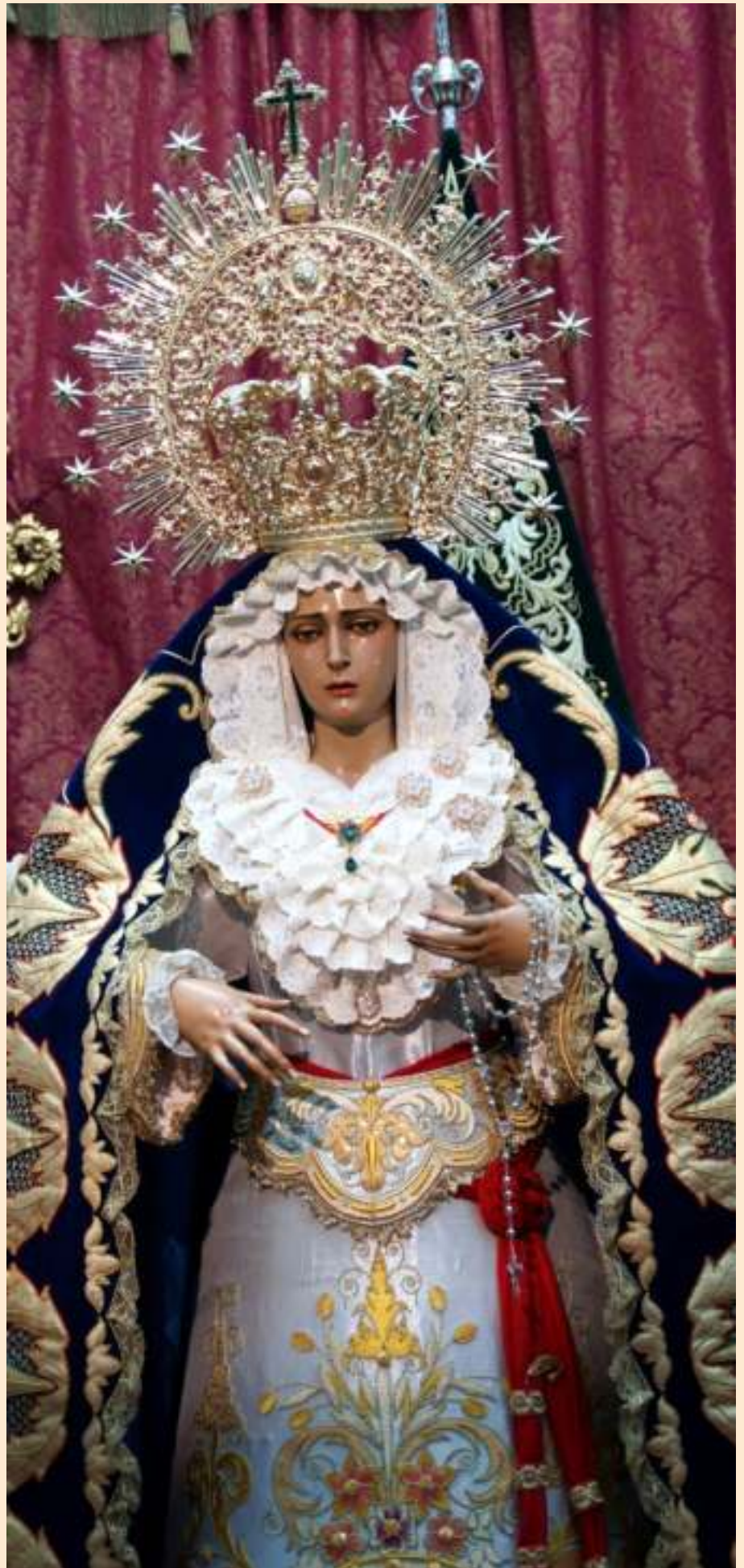
María Santísima de Palma y Esperanza en su besamanos 2017