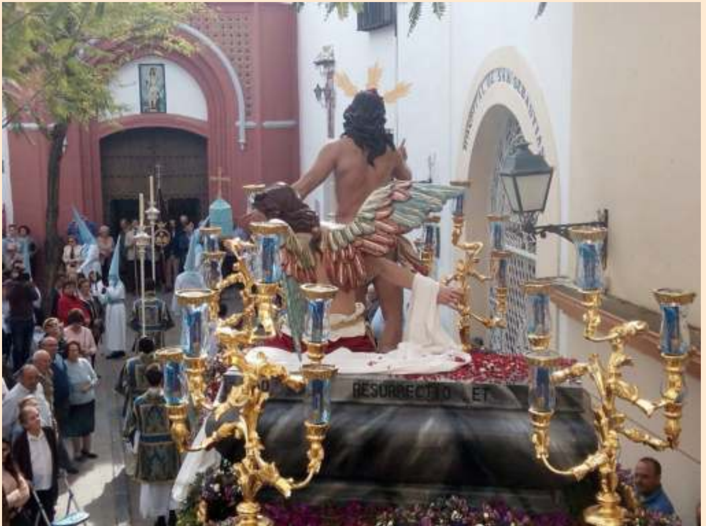
Saludo a la Hermandad del Nazareno.

En agosto del año 1992 un grupo de amigos se reunieron para formar una asociación cristiana en torno al Señor Resucitado. Los miembros de esta primera junta de gobierno eran hombres y mujeres procedentes de otras Hermandades de Palma del Río que mantenían la misma idea de que la ciudad carecía de la iconografía cristífera más importante dentro del cristianismo, la Resurrección del Señor.