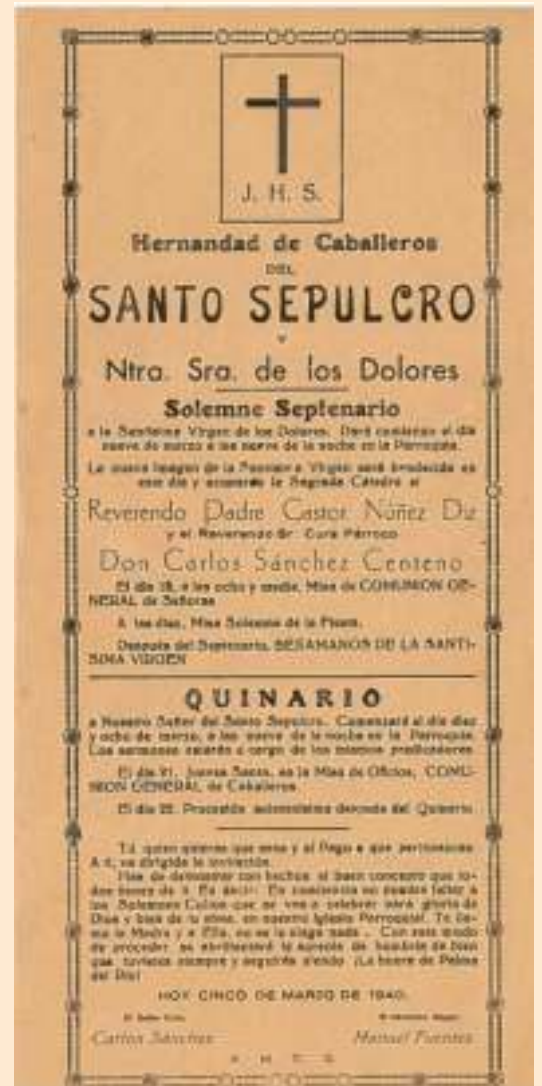
Bendición de la imagen a la Virgen de los Dolores del Santo Sepulcro, 1940.