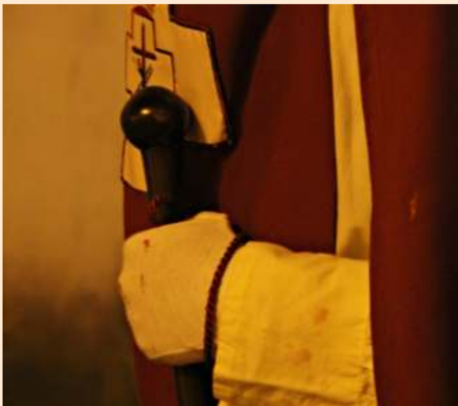
Silencio, Orden y Devoción.

En otro orden de cosas, en clave interna de la hermandad, este último año ha sido un año de despedidas y bienvenidas: despedíamos al que ha sido durante los últimos años nuestro consiliario, don Francisco, que era requerido para continuar su labor pastoral en otra parroquia; y dábamos la bienvenida a nuestro nuevo párroco y