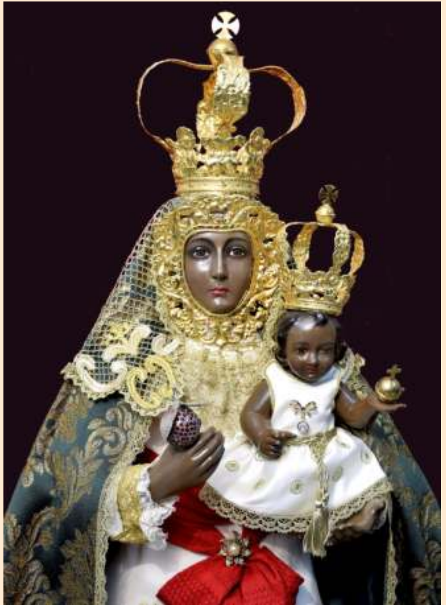
Imagen de la Santísima Virgen de la Cabeza de Palma del Río

Y es que, después de 40 años, y gracias al esfuerzo, el trabajo, la colaboración y la dedicación de muchas personas, la Santísima Virgen de la Cabeza, el día 23 de Septiembre, volvía a procesionar por las calles de nuestro pueblo, y lo haría con la grandeza y solemnidad que se merece la Reina de