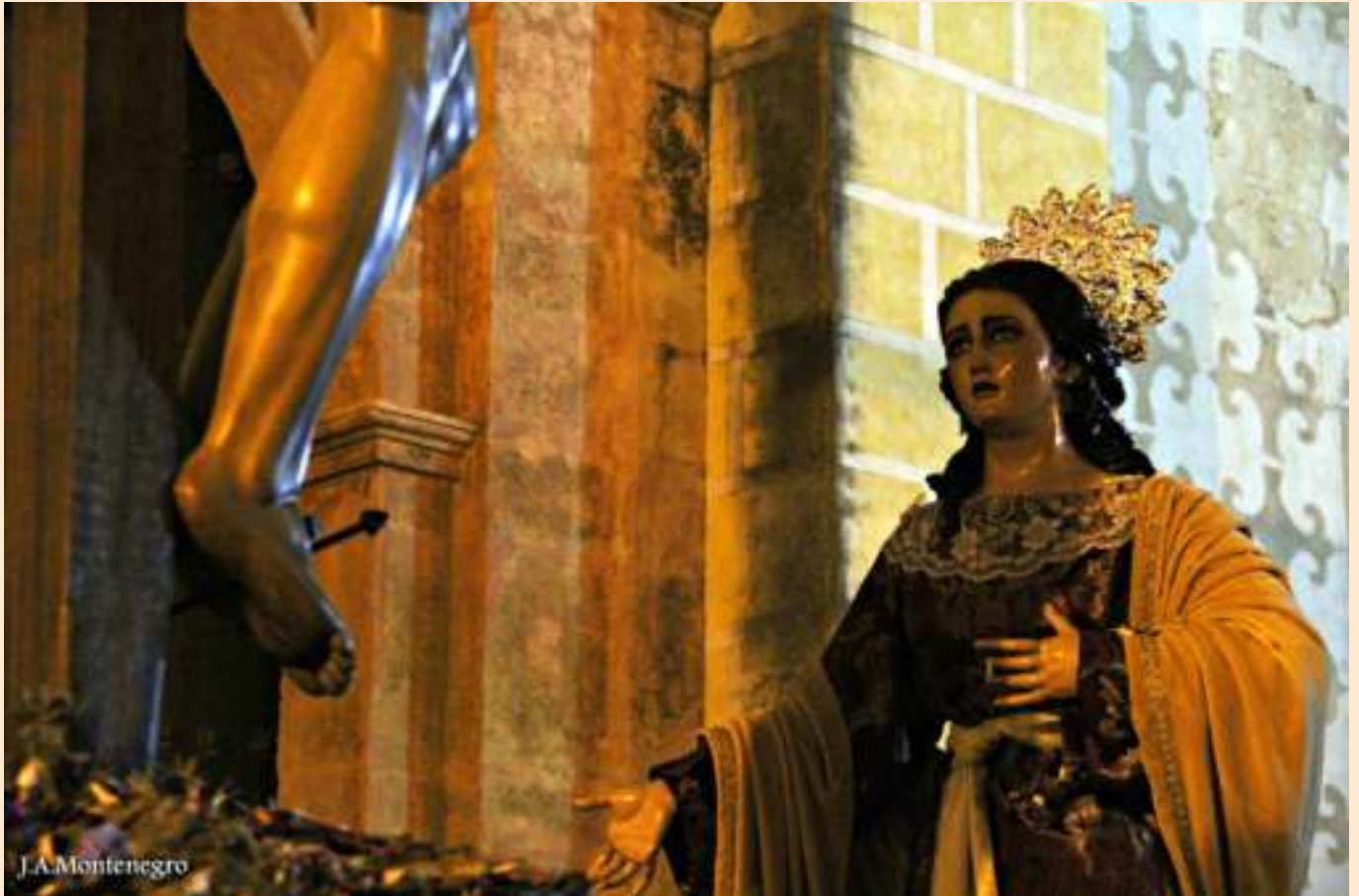
Sta. María Magdalena a los pies del Señor de la Expiración.