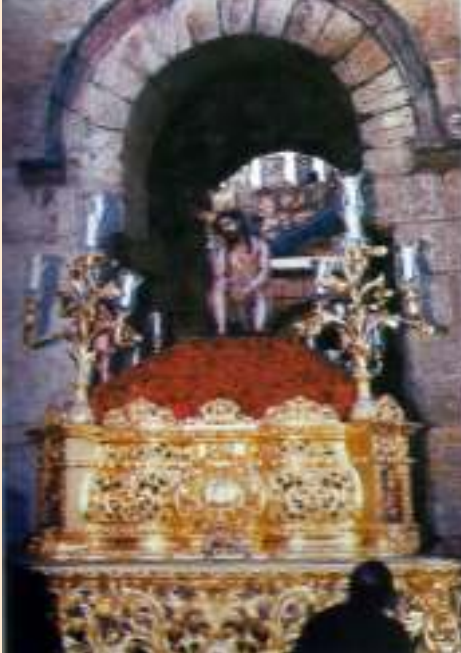
Paso del Señor Resucitado (Hdad. de la Humildad, Carmona año 2001)