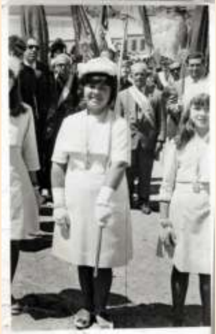
Hermana mayor de romería honorífica; al fondo la junta de gobierno de la hermandad. Romería de 1962.