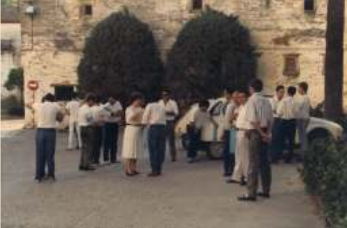
Momentos previos a la celebración del Año Santo Mariano en la Ermita de Belén, año 1988.