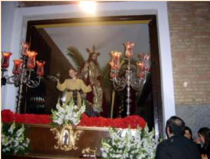
Antiguo paso 2003.