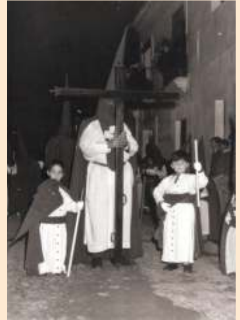
Cruz de guía desfile procesional. Década de 1960.