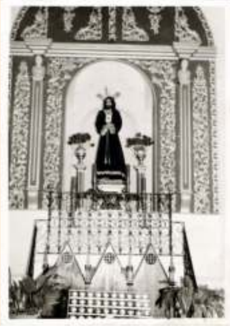
Cautivo, en el que es ahora el camarín de nuestra Madre antes del año 1975