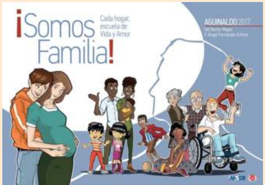
Aguinaldo del Rector Mayor