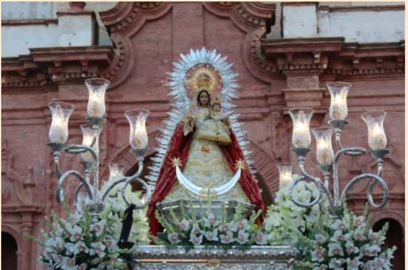
Procesión de la Hdad. de la Virgen de Belén

Consagrarse a María significa ponernos en sus manos, a su servicio y disposición. Y Ella nos guiará hacia Jesús. Consagrarnos a Ella significa dejarse llevar sin condiciones, sabiendo que Ella conoce mejor el camino y que podemos dormir tranquilos en sus brazos de madre. Consagrarse a María significa vivir permanentemente en su Inmaculado Corazón, dentro del Corazón divino de Jesús. Es dejar que Ella actúe por