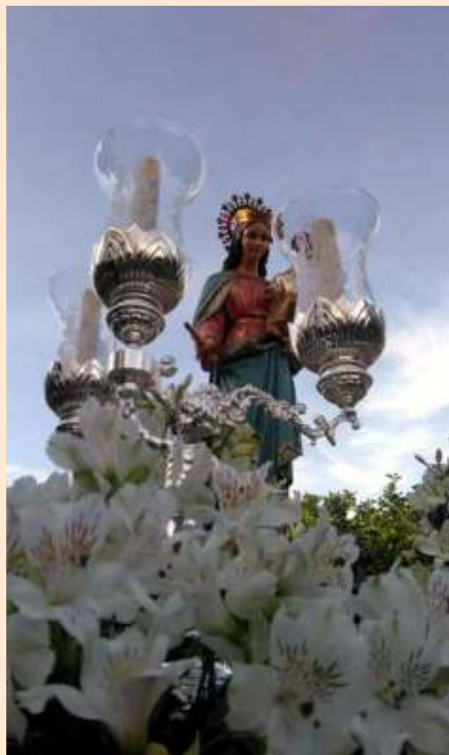
Salida Procesional 2016