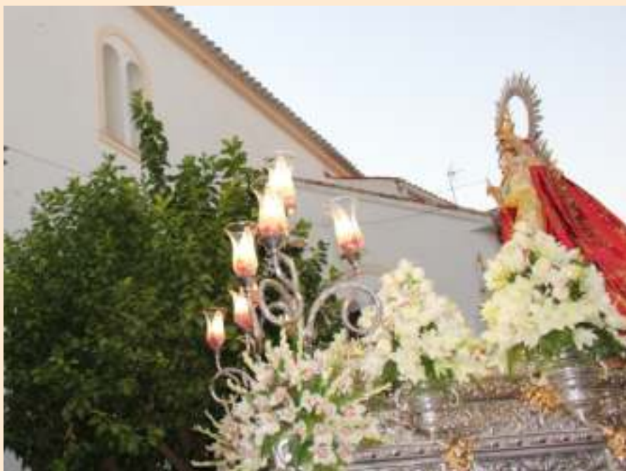
Procesión de la Hdad. de la Virgen de Belén

Virgen de Belén, concede a nuestros hogares la gracia de amar y respetar la vida, con el mismo amor con el que concebiste en Tu seno la vida del Hijo de Dios. Virgen de Belén, Santa María, Madre del Amor Hermoso, protege nuestras familias, para que estén siempre muy unidas, y bendice la educación de nuestros hijos.