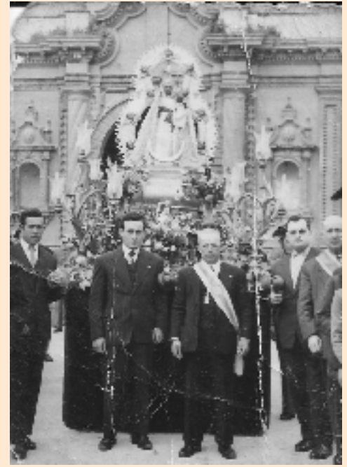
Imagen de la Virgen de la Cabeza de Palma del Río en su paso procesional, frente a la puerta de la parroquia de la asunción, el día de su salida, en la década de los años 60. Delante del paso, el presidente y el hermano mayor de la hermandad, junto a otros hermanos.