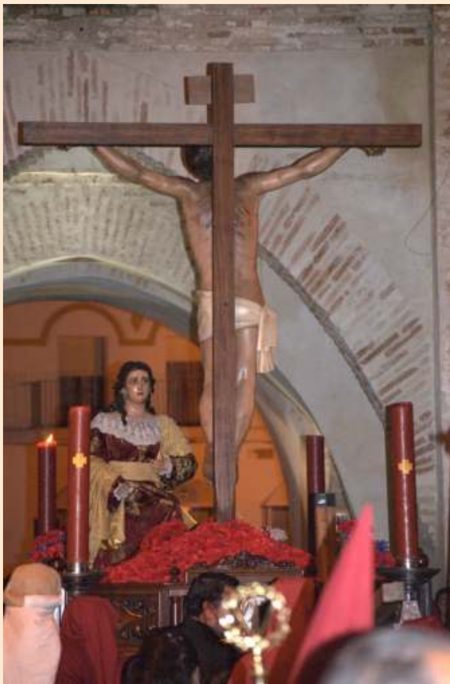
Paso de Cristo junto al Arco del Sol, 2013

Desde la Hermandad de la Expiración nos planteamos todos estos retos apasionantes durante esta Cuaresma, para que sean actitudes propias de todos los hermanos que formamos esta pequeña gran familia. Y como familia que deseamos ser, hemos vuelto a hacer memoria, porque es la única forma que tenemos los seres humanos de saber quiénes somos y dónde nos encontramos. Y en nuestro afán de hacer de la memoria algo que perdure para siempre hemos inaugurado una galería histórica en las dependencias que la hermandad tiene cedidas en nuestra casa, la Parroquia de la Asunción. Desde aquí invitamos a todos los que deseen conocernos un poquito más a acercarse en el horario establecido para conocer más y mejor nuestro quehacer diario. Este proyecto ha supuesto un esfuerzo titánico para un grupo de hermanos que creyeron desde el principio en esa frase que reza: “Un pueblo sin pasado es un pueblo sin futuro”, y han volcado toda su energía en que un proyecto tan hermoso se pueda convertir en realidad, confiando en algo que tenemos muy claro los hermanos de la Expiración: la necesidad de