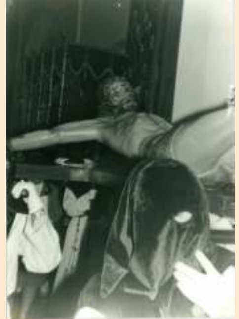
Estación de Penitencia del Cristo de las Aguas. Semana Santa 1997.