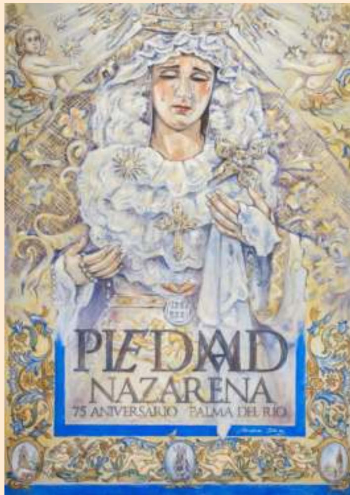
Cartel Conmemorativo del 75 Aniversario de María Santísima de la Piedad

Unidos por la Fe, unidos por el espíritu que Cristo nos dejó, unidos por el amor de una madre hacia su hijo, es lo que nos mueve a todos y cada uno de los que formamos parte de esta pequeña Hermandad.