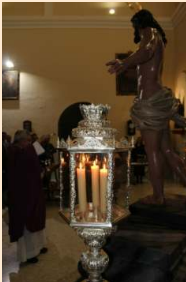
Bendición de la nueva imagen del Señor Resucitado, 5 de marzo de 2016

El próximo 13 de Mayo celebramos el centenario de las apariciones de la Virgen de Fátima, en nuestra diócesis se está conmemorando dicha efeméride con la visita de la imagen peregrina por todas las parroquias de la provincia, en nuestra ciudad sería el mes de enero cuando dicha imagen visitó nuestras parroquias desde el 11 al 14 de enero la comunidad cristiana de Palma del Río recibió y rindió culto a la Virgen de Fátima, un fin de semana donde no faltó la Hermandad del Resucitado.