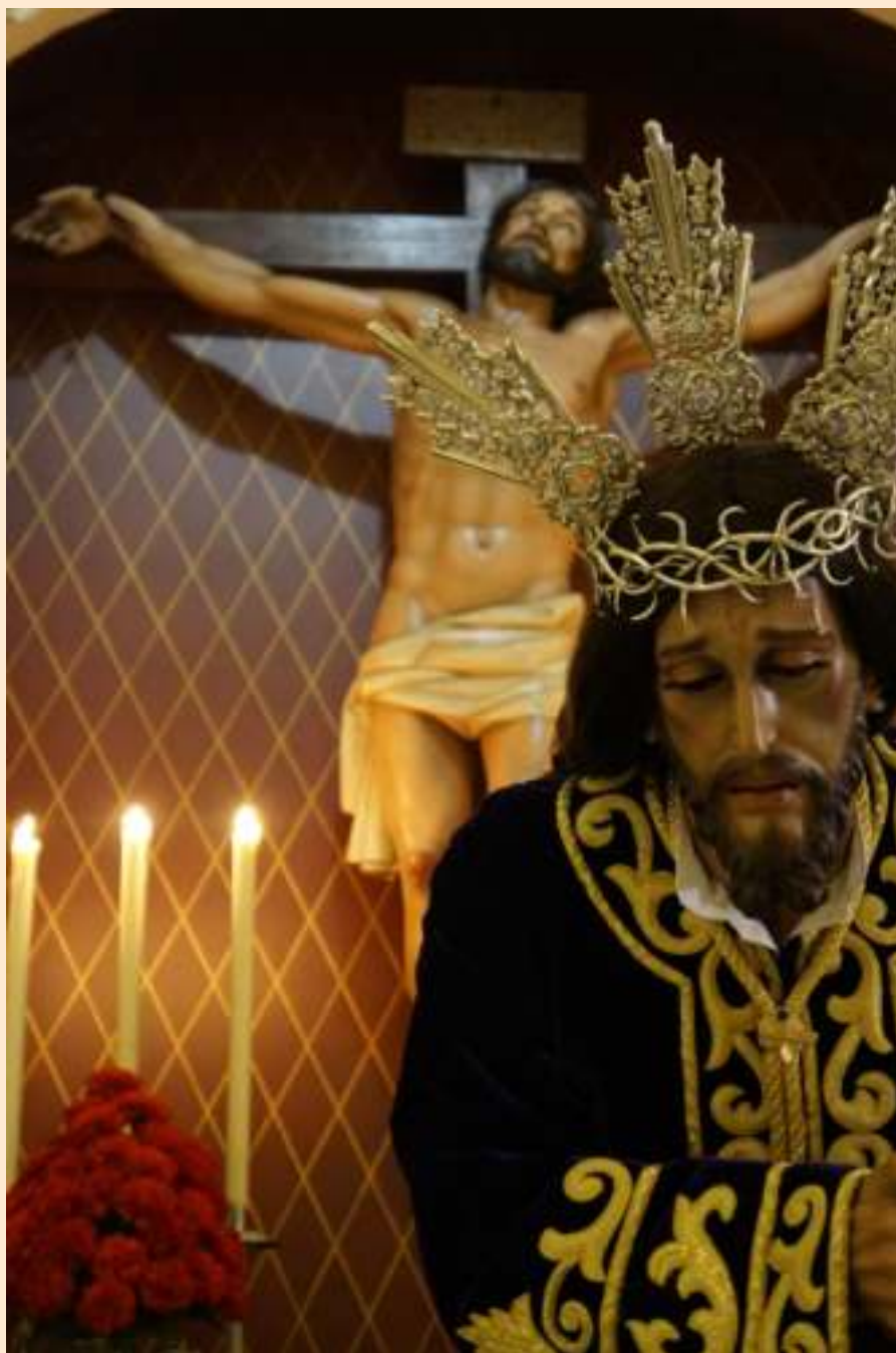
En tu Expiración Señor esta tu pueblo.

Actos y cultos que no serían posible si nos faltara la Fe, la devoción, la unión entre hermanos, todo aquello por lo que Cristo murió por nosotros. Desde las hermandades debemos siempre cuidar la unión y el PATRIMONIO HUMANO, patrimonio muy importante que los más mayores nos han ido trasladando, donde la Fe esta por encima de cualquier exorno florar, cualquier acompañamiento musical, cualquier pie-