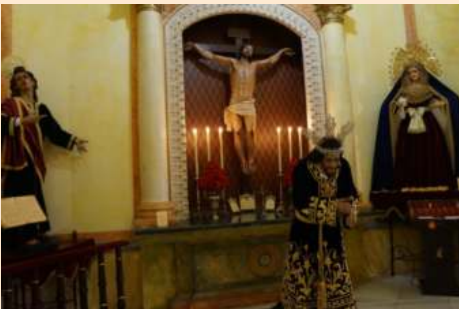
Jesús Nazareno en la Capilla de la Expiración en su 75 Aniversario, momentos antes de ser subido a su paso