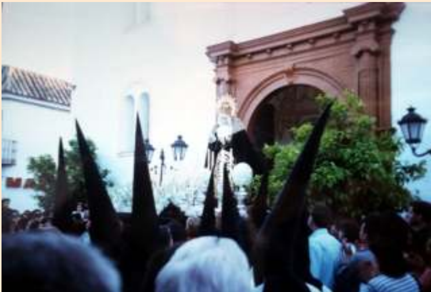
Años 90. Salida de M a Stma. de los Dolores desde la Iglesia de Sto. Domingo por las obras en San Francisco