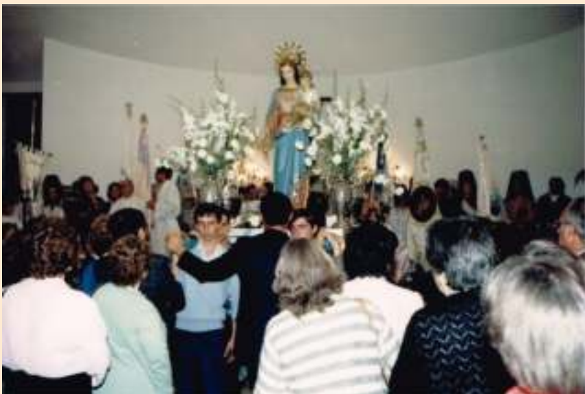
XV Asamblea ADMA, mayo de 1987