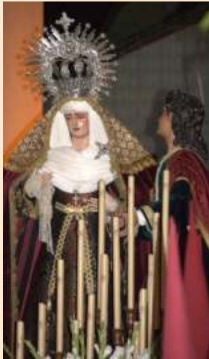
Paso de Virgen a su paso por el Palacio Portocarrero, 2013

El ayuno , como medio para solidarizarnos con el otro, con el que sufre, con el olvidado, con el necesitado de tantas cosas materiales... El ayuno como experiencia de “mirar hacia afuera” en lugar de perdernos en nuestra auto-complacencia, en nuestro “yo” como si no existiera nada ni nadie a nuestro alrededor. Un ayuno que puede y debe significar la búsqueda de lo que es fundamental en nuestra vida, para liberarnos de la esclavitud de lo superfluo, de la tiranía de lo que los demás