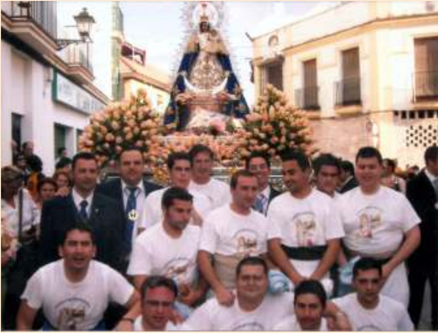
Cuadrilla de la Hermandad del Señor Resucitado en la salida extraordinaria de la Virgen de Belén en diciembre del año 2004 por la celebración del CL aniversario de la proclamación del Dogma de la Inmaculada Concepción.