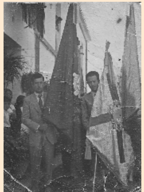
Hermanos de la Hermandad de Ntra. Sra. de la Cabeza de Palma del Río portando las banderas y el banderín de la Hermandad durante su salida procesional. Década de los años 60.