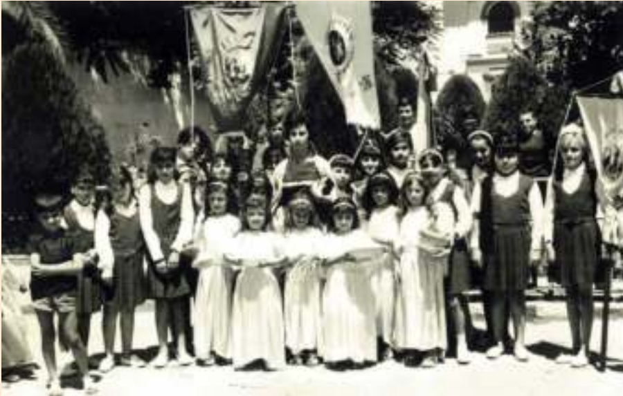
Grupo de niñas vestidas de angelito con su catequista, el día del Corpus. Año 1962.