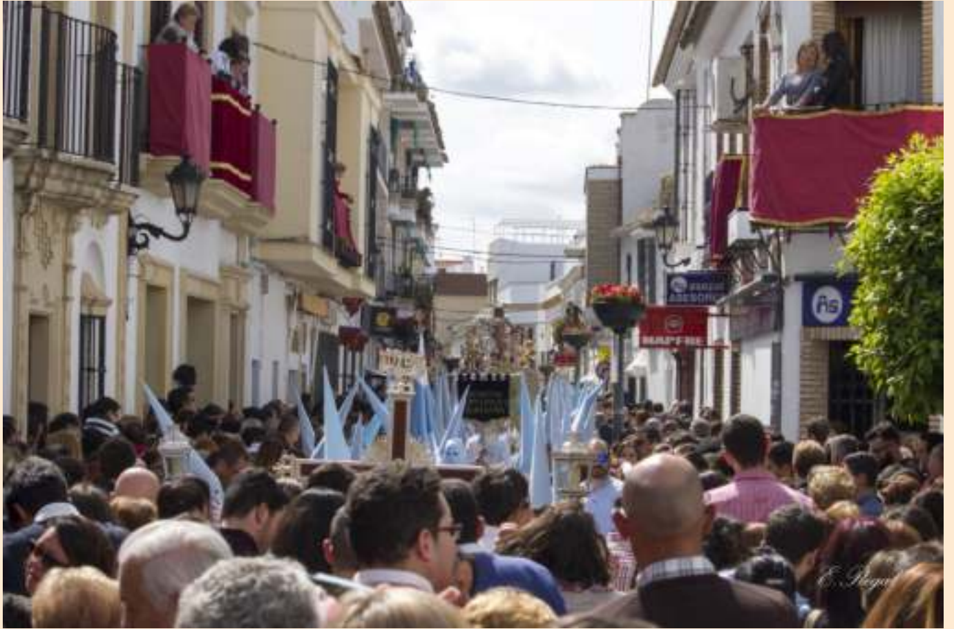
Llegada a Santo Domingo el 27 de marzo de 2016

La Hermandad del Señor Resucitado, Ntra Madre y Sra de la Aurora y Stmo Rosario de Ntra Sra en sus Misterios Gloriosos no olvidará fácilmente la fecha del 5 de marzo del año 2016, una fecha que ya se encuentra marcada en las páginas de la reciente historia de la cofradía. Ya hace casi un año que nos reunimos todos los hermanos en torno a la nueva imagen del Señor Resucitado para bendecirlo, como testigo a este humilde acto la Iglesia de Santo