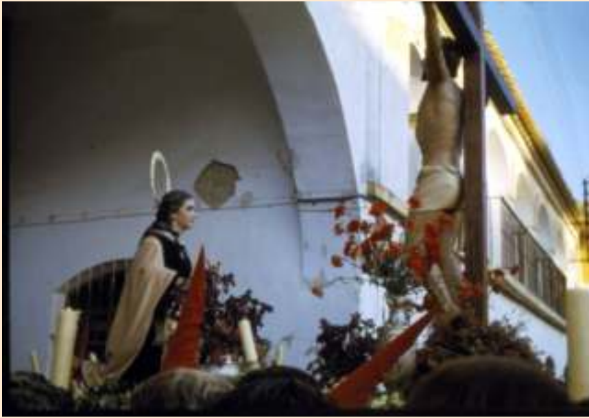
Paso de Cristo a su paso bajo el antiguo arco de la calle Ruiz Muñoz