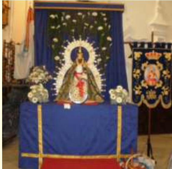
Altar de culto en la Función Principal de Instituto de la Hermandad.

Además, en esta ocasión la celebración era más importante, si cabe, que en otras ocasiones; en ella se bendecía el nuevo candelero de la imagen de la Virgen de la Cabeza, titular de la Hermandad, tras ser restaurada por las manos del imagi-