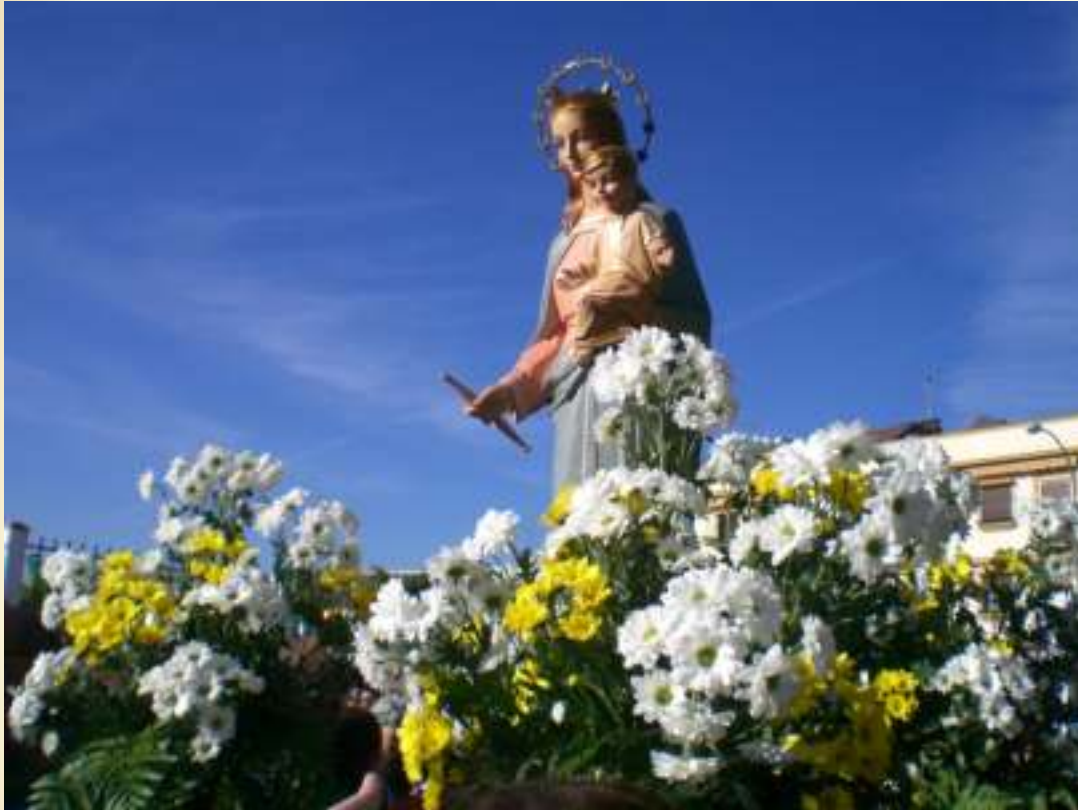
Nuestra Madre recibe las Reliquias de San Juan Bosco

La ADMA de Palma del Río camino de cumplir 50 años