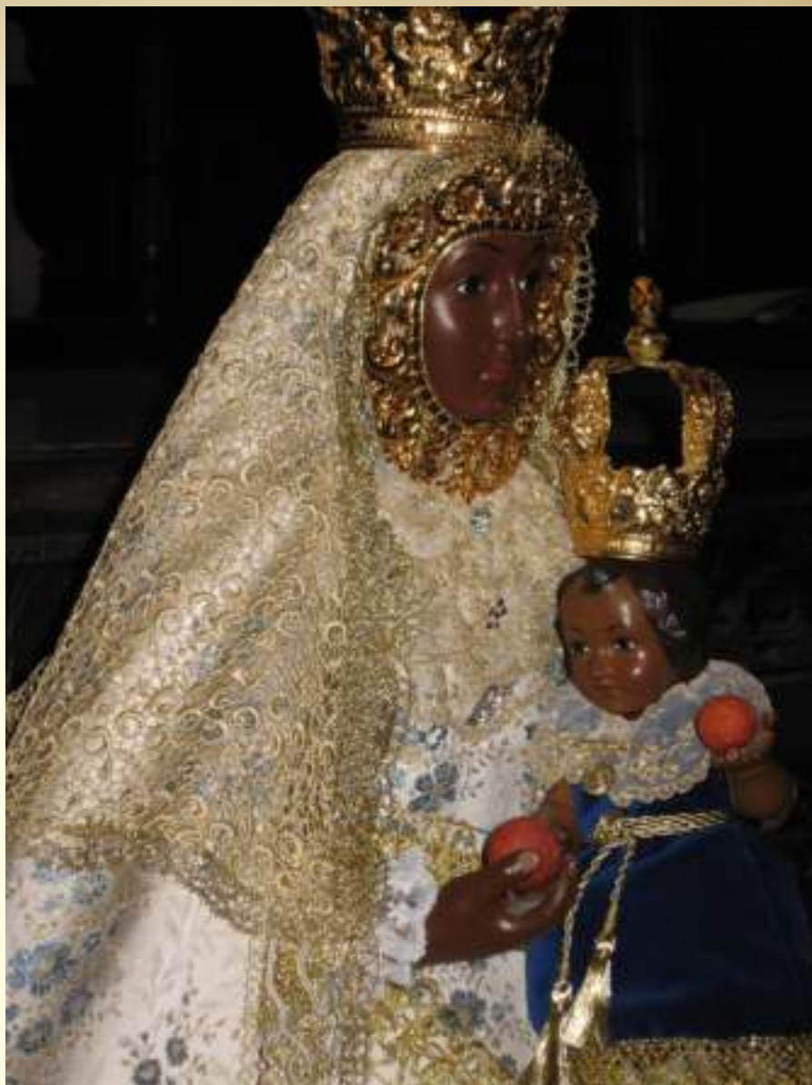
El Chocolatín del Cielo

También intentamos ser miembro activo del tejido asociativo de nuestro pueblo, participando en las actividades desarrolladas,