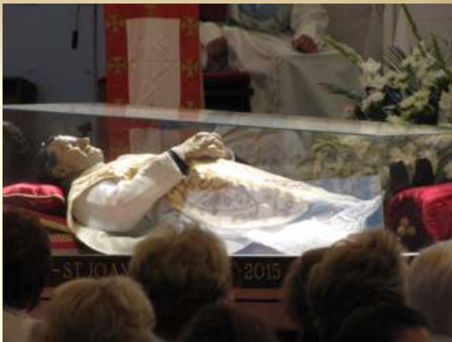
Las reliquias de San Juan Bosco veneradas en Palma del Río

cativo Pastoral Local colaboraremos, en algunas de las actividades que se organicen en el Colegio: Catequesis, Oratorio-Centro Juvenil y campañas misioneras y de solidaridad.