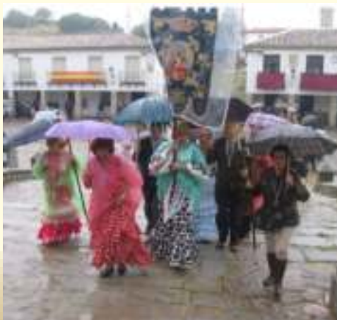
Al encuentro de Nuestra Señora

Al día siguiente, enfrentándonos nuevamente a la lluvia asistíamos a la Solemne Eucaristía celebrada en la Basílica del Real Santuario de la Virgen de la Cabe-