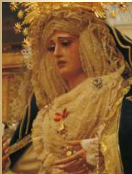
Nazarena del Viernes Santo