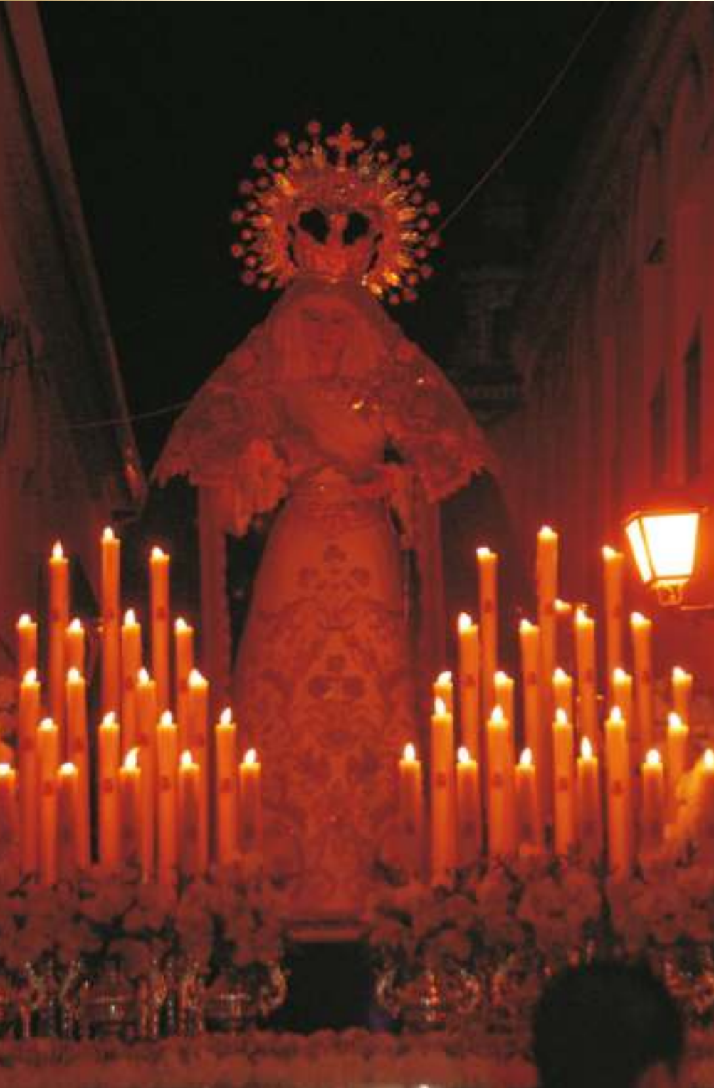
Ntra. Sra. de la Piedad

Sí, soy hermano de dos cofradías de nuestro pueblo, de la Hermandad de Nuestro Padre Jesús en su Entrada en Jerusalén y María Santísima de la Estrella, y de la hermandad de Nuestro Padre Jesús Nazareno y María Santísima de la Piedad. A cada una les guardo un gran aprecio y un gran cariño pues he vivido momentos inolvidables. Soy capataz del paso de M ra Stma de la Piedad como