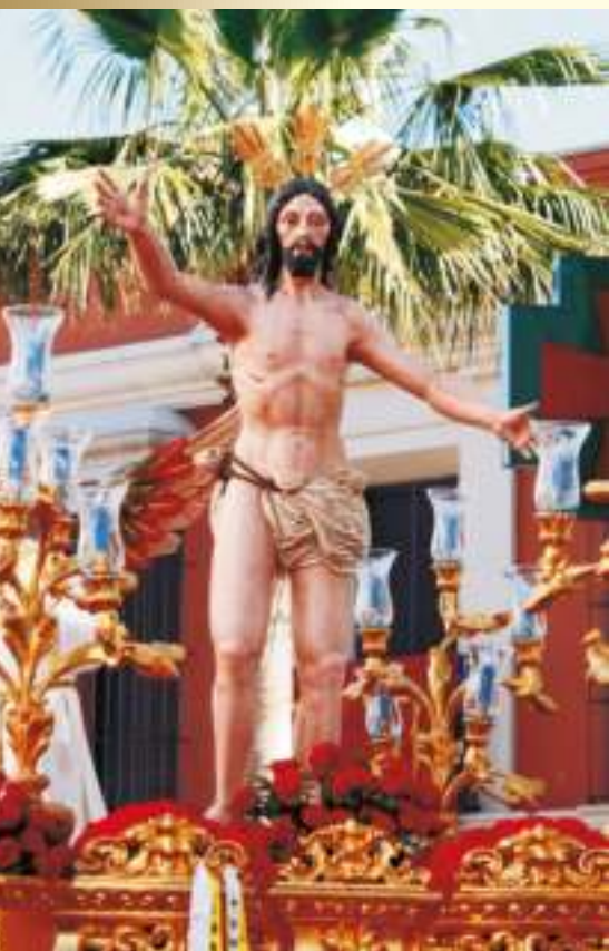
Misterio de la Resurrección

Cada vez que oigo a una persona decirle a otra “Vaya usted con Dios” me estremezco al pensar que quizás estén hiriendo la sensibilidad de esa persona a la que acaban de saludar y, por qué no, al resto de ciudadanos que por allí andamos.