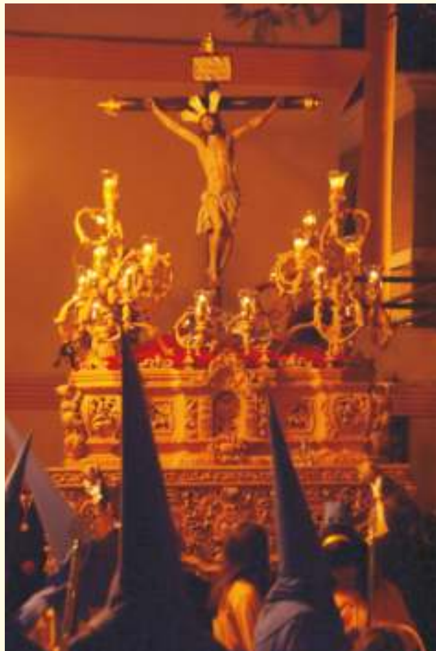
Salud en la Residencia de Ancianos