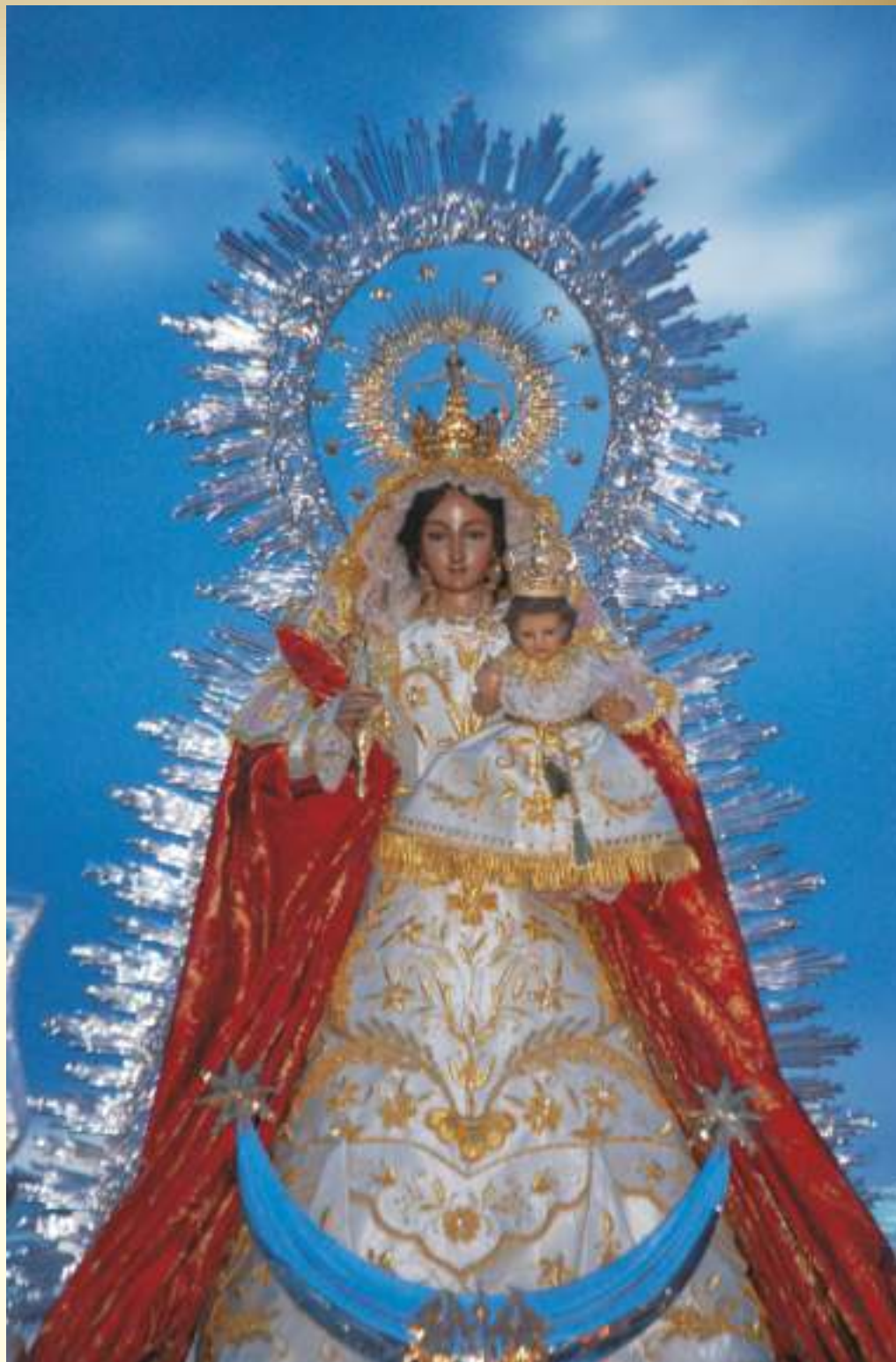
Bendita entre todas las mujeres, Madre de Belén Coronada

Nos quejábamos, delante de tu dolorido rostro, de que nos habías abandonado, precisamente porque