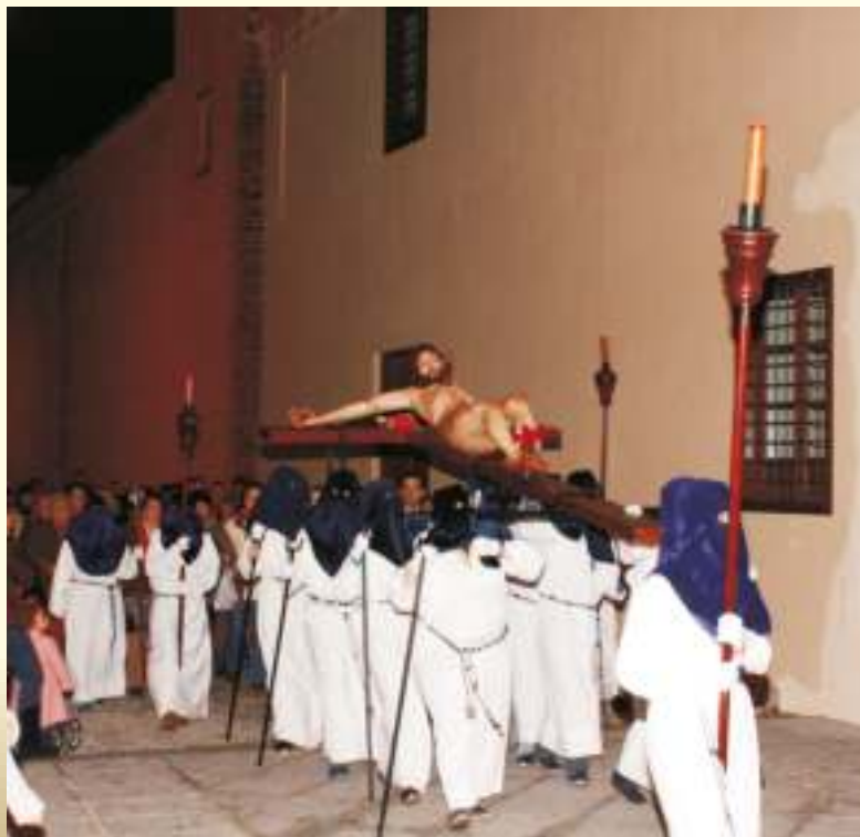
Lunes Santo penitente