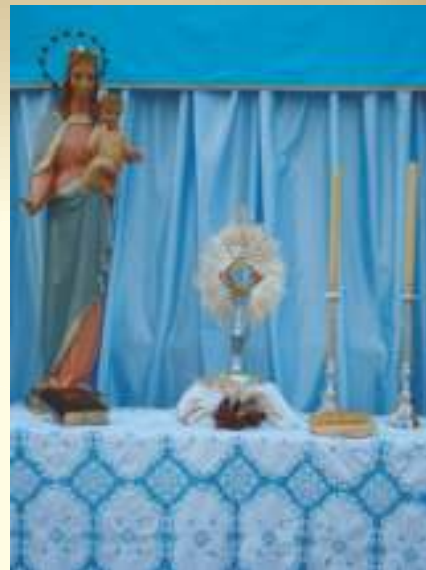
Altar del Corpus