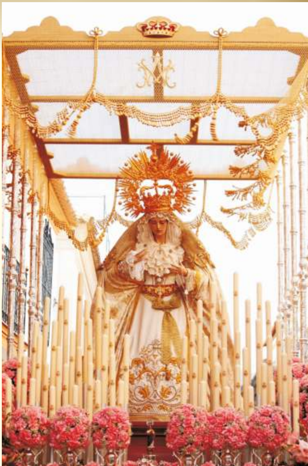
Un palio para una Estrella que brilla con luz propia cada Domingo de Ramos

Como no recordar también a nuestros fundadores, la Adoración Nocturna, que en 1971 comenzó la andadura de la Hermandad de la Borriquita, hoy Her-