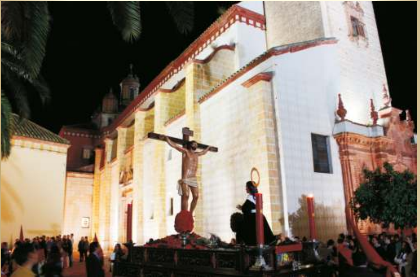
Expira el Jueves Santo, comienza la "madrugá"