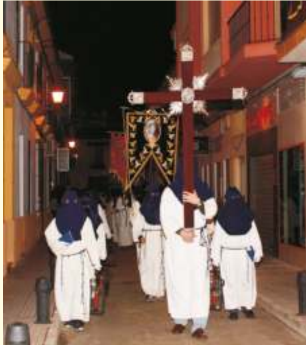
Toma tu cruz y sígueme

Se aproxima, aunque este año un poco más demorada en el calendario, la Semana Santa, semana en la que entre todos revivimos el misterio de Jesús de Nazaret a través de pasos, trompetas, palios, capirottes, ciriales y el magnífico y esperado olor a azahar. Un olor que impregna calles, patios, callejones y jardines con una manta blanca de un olor que todos ansiamos por tener presente. Esfuerzo de todo un año que se ve recompensado en los 8 días que nuestro Señor y nuestra Madre pasean por las calles de nuestro blanco pueblo impregnado de incienso, cera e ilusiones por encon-