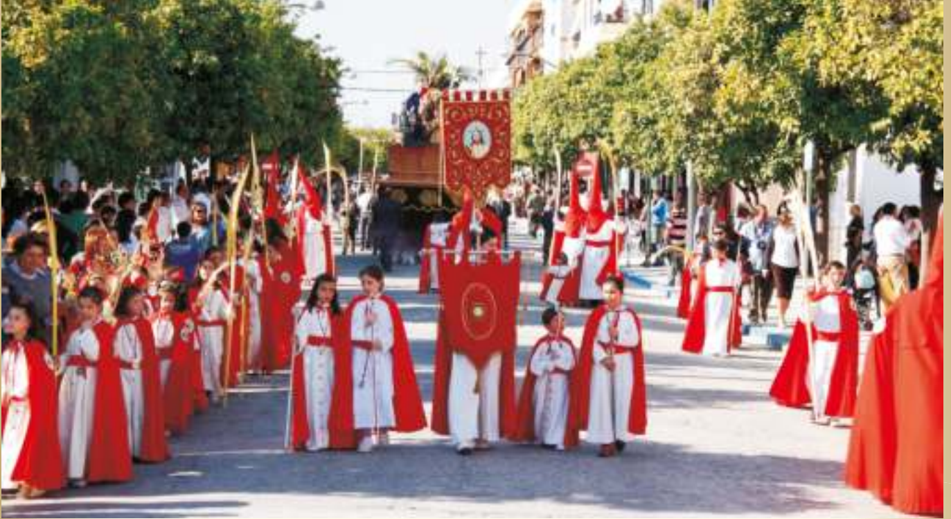
Cristo entra triunfante por la Avenida de Córdoba