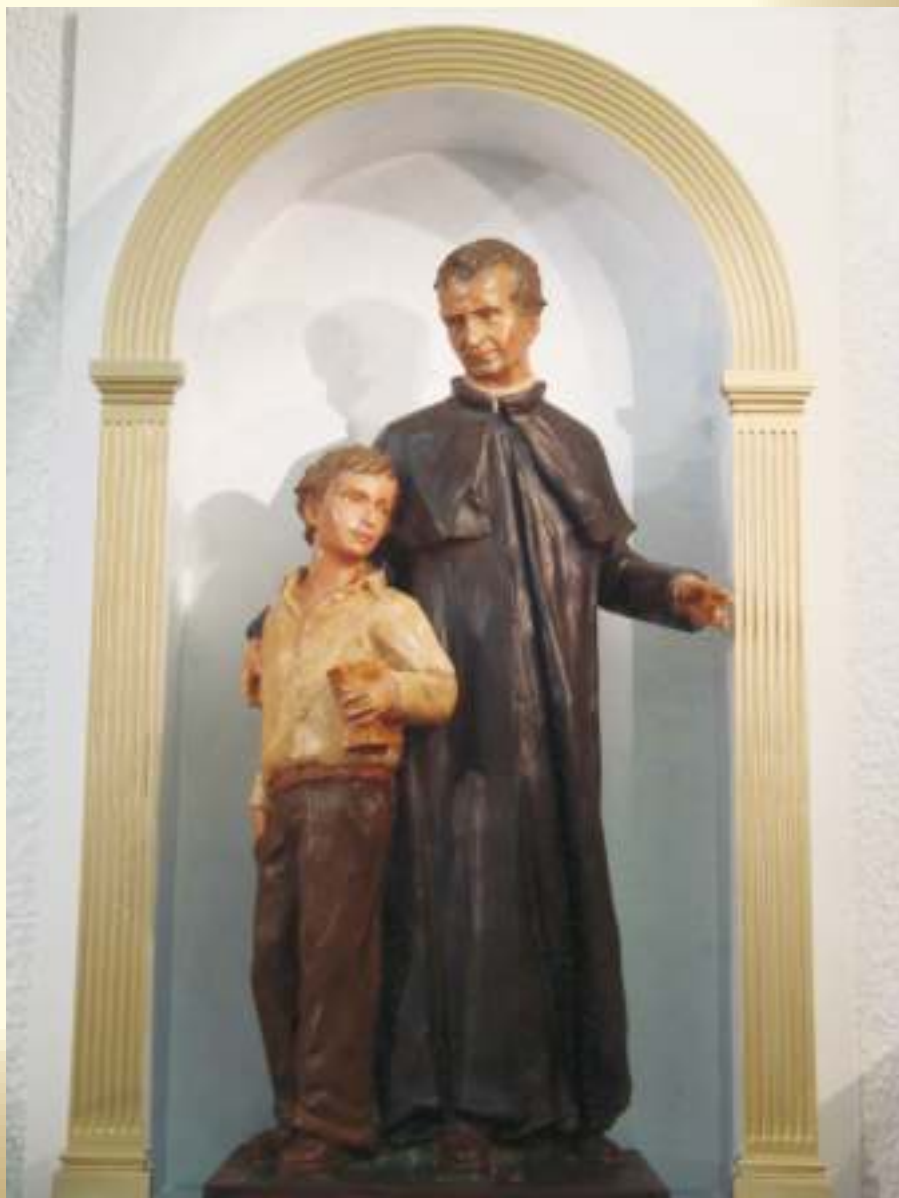
"Con amabilidad te ganarás a los jóvenes"