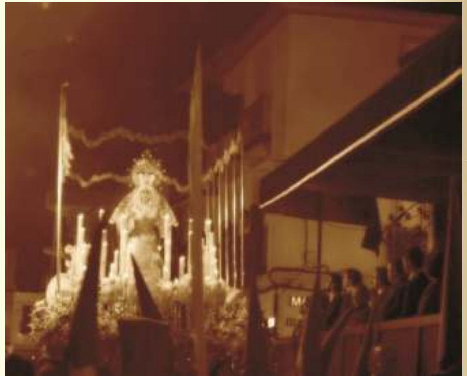
Paso de Palio de Ntra. Sra. de Palma y Esperanza

que sonreía y que la vida había vuelto a sus ojos llorosos después de tanto tiempo, con los brazos extendidos y en silencio pedía perdón y consuelo a su hija y a su mujer que lo abrazaron y lloraron junto a él. Esa noche, todos durmieron un sueño plácido y agradable, un sueño cálido de vida y esperanza. La tormenta pasó y un día sin nubes, de cielo despejado, nació de nuevo en Palma del Río. De mañana temprano el paso y las imágenes fueron devueltos a su capilla en la parroquia de San Francisco. Padre, madre e hija