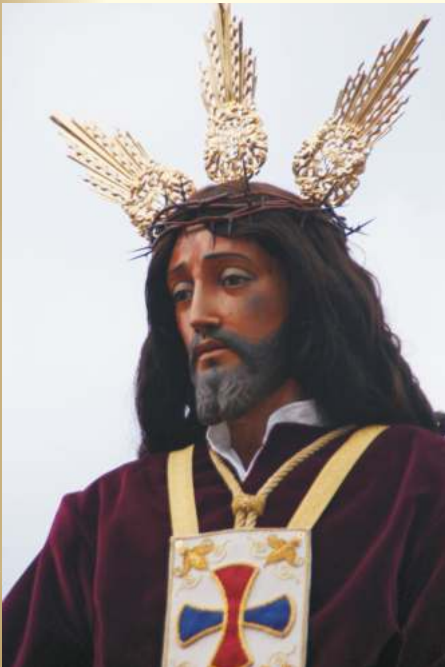
Cautivas con tu mirada