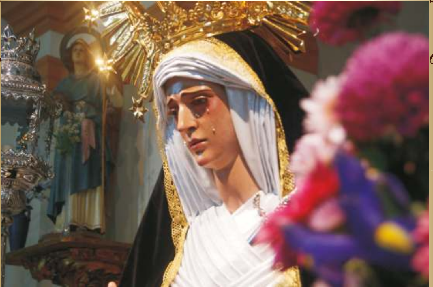
Dolores de San Francisco, cuánto me gusta tu llanto

Olor de azahares, por viejas plazuelas.... La cuaresma vuelve a nacer en Palma del Río como florece el azahar de sus naranjos. El sol volverá a brillar de nuevo, llamando a la vida tras un invierno frío y un año duro. Varales al viento, con marcha amargura, de nuevo la noche volverá a caer, y el frescor del relente se disimulará con el calor que emana de la cera encendida, con el murmullo de la gente, que se agolpa en calles estrechas ante el paso de nuestra cofradía.