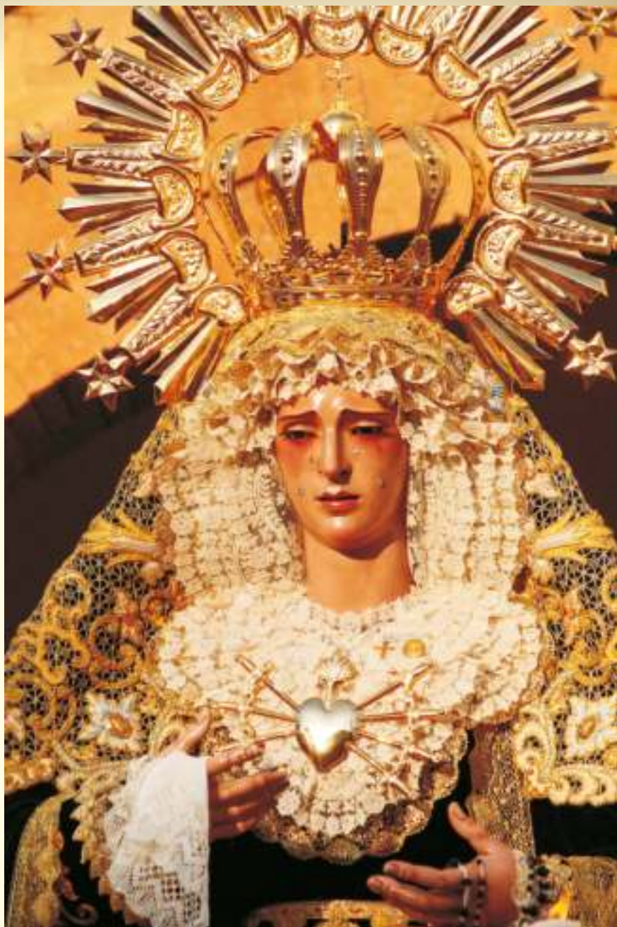
Los siete dolores de María

Sobre esos ejes se han mantenido el sentir cofrade y es donde hoy radica su fuerza. Una nueva