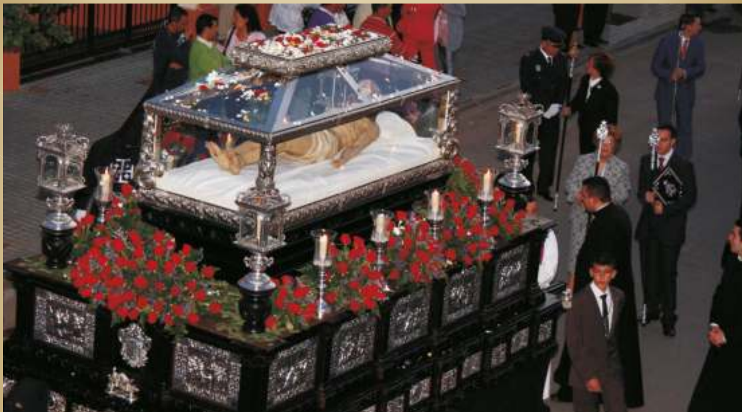
Santo Entierro de Cristo en la tarde del Viernes Santo