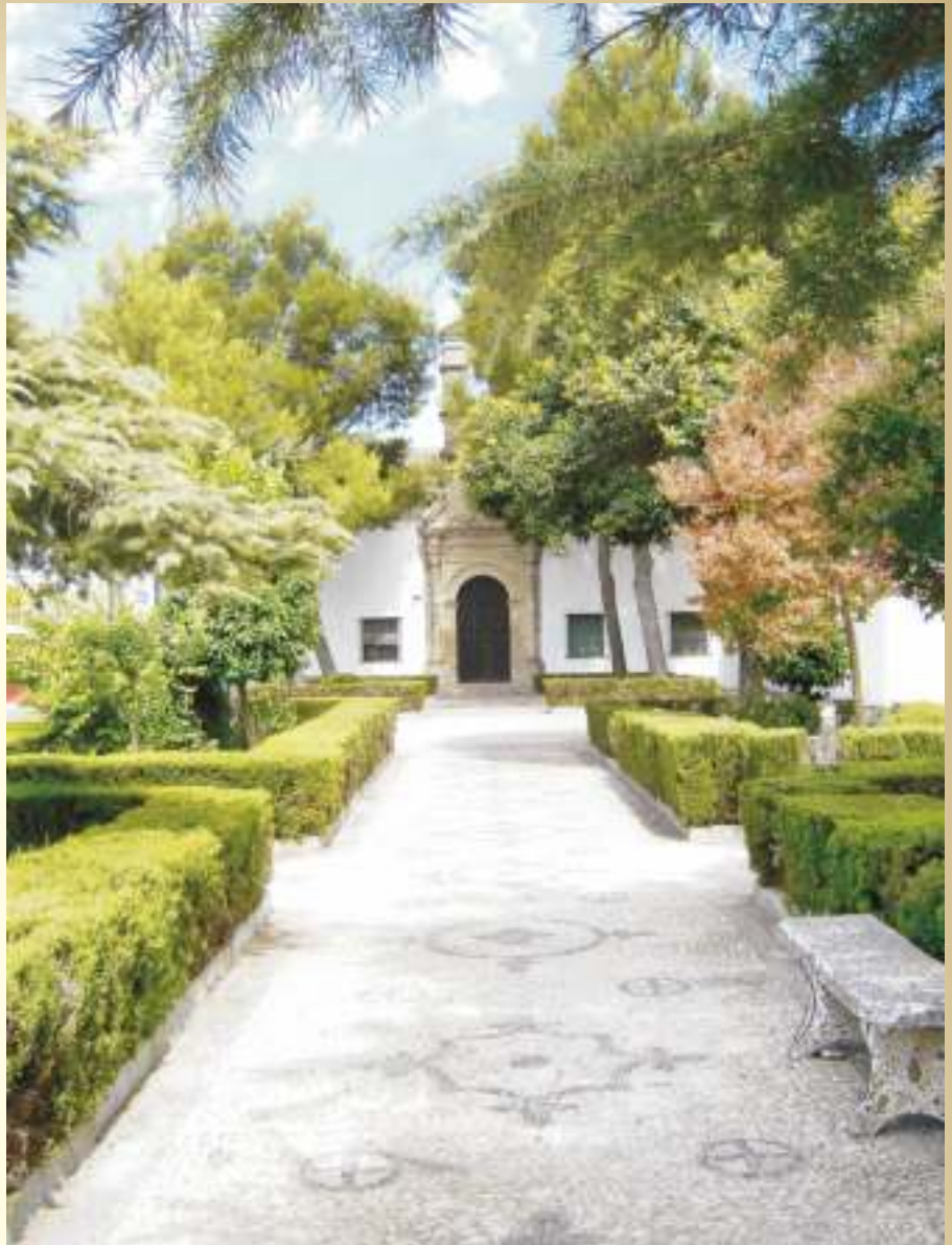
Jardines de San Francisco donde se colocará el monumento dedicado al Padre Paco

Confieso que son muchas mis deficiencias en este servicio. Pero hago algunas "cosillas", sobre todo insistir "con ocasión y sin ella" que las Cofradías y Hermandades tienen una misión especial en la