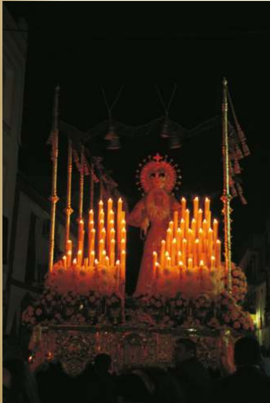
Bendita sea tu pureza