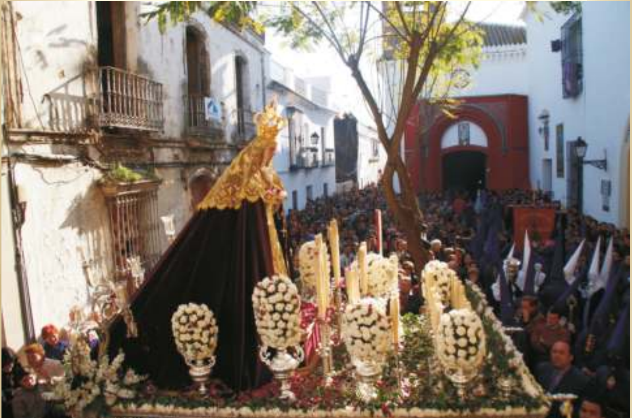
Amanecer mágico de una madrugá eterna