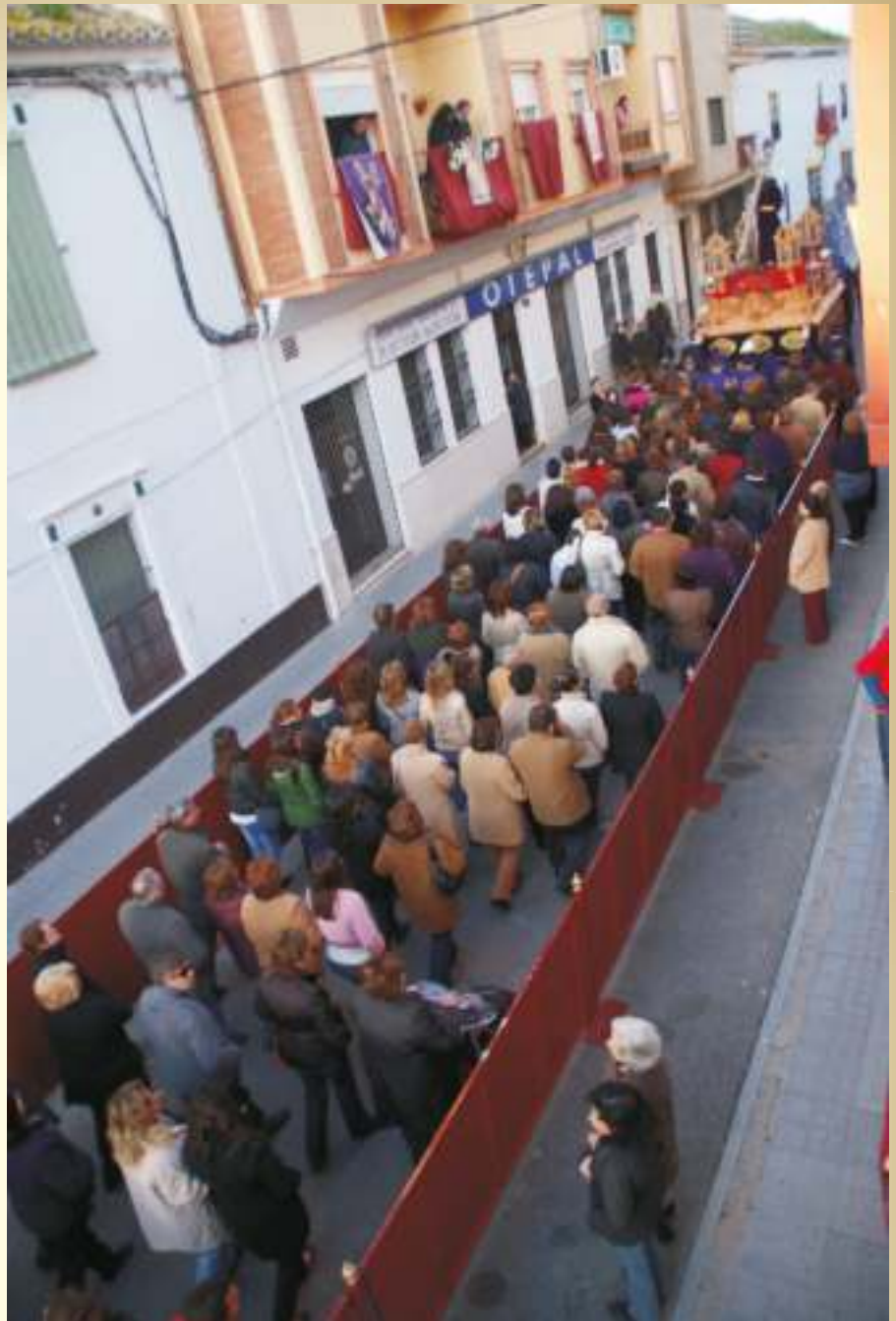
Seguimos tus pasos, Señor

Gracias a todas las personas, asociaciones, entidades, casas comerciales y empresas que con su ayuda hacen posible la realización de actos y actividades que permiten el sostenimiento de esta Hermandad.