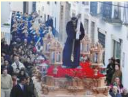
400 Años contigo Nazareno

¡Gracias Hermanos de nues- tra Hermandad! Gracias por apo- yarnos año tras año y seguir admirando con devoción a Nues- tro Padre Jesús Nazareno y su Santísima Madre la Virgen de la Piedad y San Juan Evangelista, para que con vuestra continuidad seamos capaces de seguir dando culto a nuestros sagrados titulares, renovando y adqui- riendo nuevo patrimo-nio y ajuar de los mis- mos y con nues-