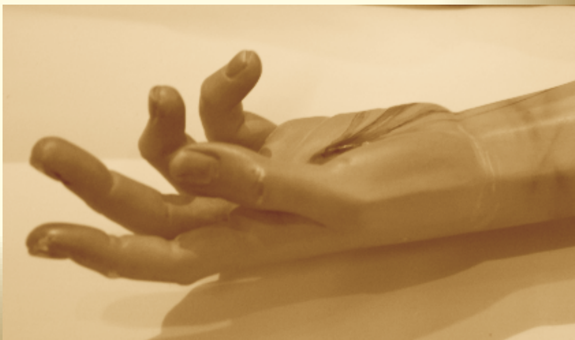
En tus manos encomiendo mi espíritu