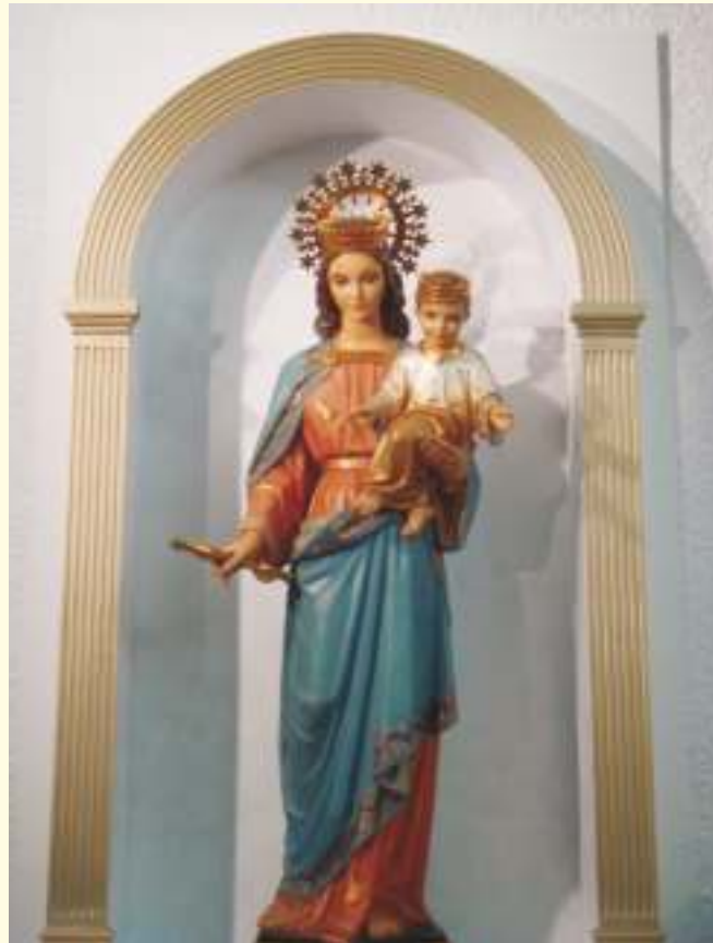
Rendidos a tus plantas, fúlgida estrella

No son pocos los padres que encuentran dificultades con sus hijos: