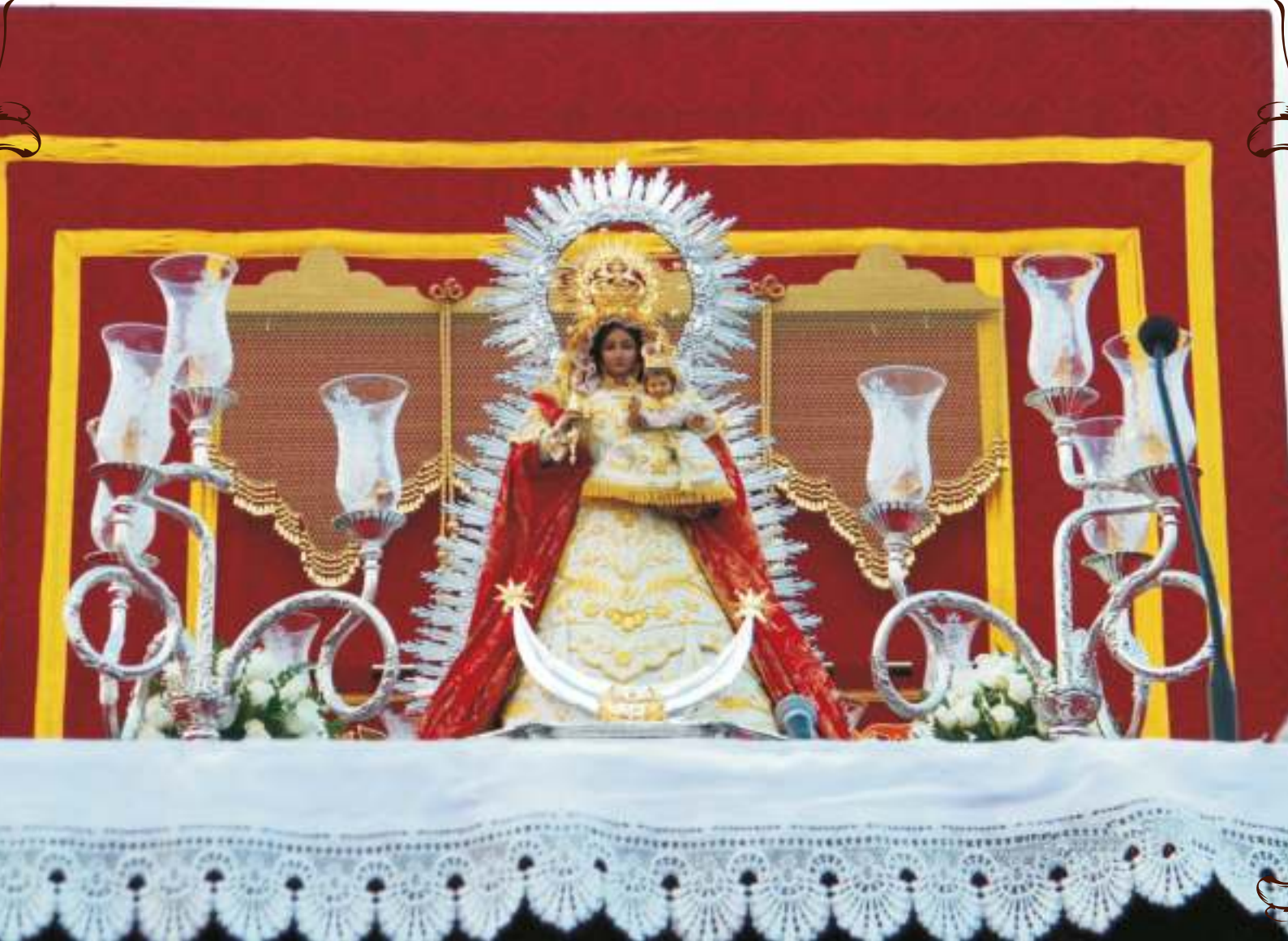
Altar de la gloria, Coronada por amor

!Enhorabuena! ¡Felicidades! Se cumplen 25 años, y como tal hay que celebrar el acontecimiento con una fiesta con invitados. También es tradicional la realización de