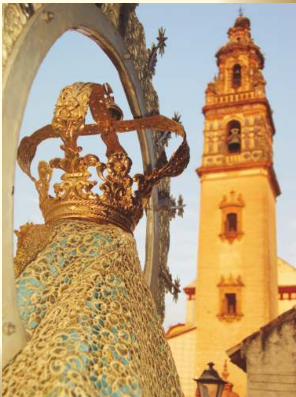
Morenita como una aceituna, reina de Sierra Morena