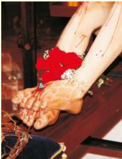
Clavado en una cruz y escarnecido

Enfoquemos ahora todos los acontecimientos, actos de caridad, voluntariedad y disponibilidad llevados a cabo en el seno de nuestras hermandades durante todo el año a nuestros titulares y