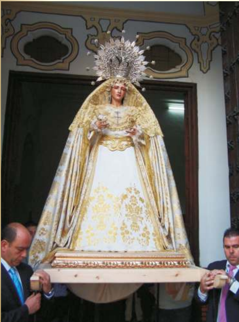
En tu Aurora de resurrección

imagen puede ser cualquiera de las que vimos ese bendito día 8 de Mayo (día de Ntra. Sra. de Luján entre otros). No sólo se vivió un día grande el 8 de Mayo. Dos arraigadas hermandades de nuestro pueblo celebraron efemérides, la Hdad. del Nazareno y la Hdad. del Cristo de la Salud. Existen pocas instituciones que cumplan tantos años y me pregunto porqué, pese a los avatares de la historia las hermandades han permanecido en el tiempo con sus altibajos y me pregunto si algo tendrá que ver la intervención divina. A veces parece mentira poder continuar con toda esta labor que las hermandades llevamos a cabo, incluso caemos en el pesimismo de que lo que hacemos no puede durar mucho, dudamos de la continuidad de esta forma de entender el cristianismo, además de soportar las acometidas de las críticas más ofensivas que vienen del puro desconocimiento. Pero siempre hay algo que soluciona todo, algo pasa que de repente lo ves todo más claro, más fácil y volvemos a trabajar por lo que creemos. Felicitamos a los amigos del Nazareno y de la Salud por sus aniversarios para que sigan creando historia