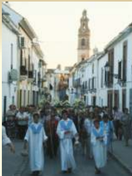
Mes de Mayo, mes de María Auxiliadora