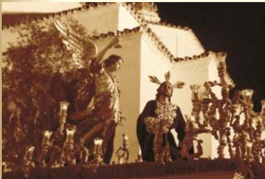
Paso de Misterio de la Oración en el Huerto

Sentado en un gran butacón, a oscuras, fumaba una pipa sin más luz que las ascuas que se prendían en su cazoleta. El recuerdo de la imagen de Jesús Orando en el Huerto, seguía grabada intensamente en su memoria. Su cara reflejaba dolor, miedo y resignación "Padre hágase tu voluntad y no la mía" Todos lo habían abandonado en aquella oscura noche, en la que Jesús ya sabía cual sería su destino, pero su determinación era fuerte, y aunque el cáliz que se le ofrecía era amargo, Él lo degustaría, porque sabía cual era su responsabilidad, debía morir por el hombre, si su sacrificio fue grande, mayor aún fue su victoria. Pero aún así abandonado por sus amigos y solo, nunca se había rendido. Nuestro protagonista seguía fumando mientras estos pensamientos se iban colando en su cabeza, agujoneándolo, su dolor fue grande, pero él tuvo a una mujer y a una hija a su lado, y