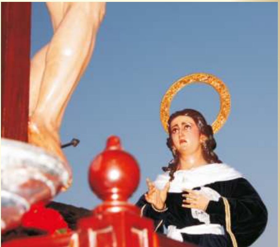
¿Por qué buscas entre muertos al que vive?