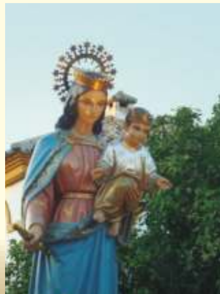
Cada vez que te miro eres más bella

mi hija"... Es una expresión que escuchamos con frecuencia.