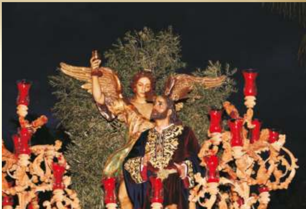
Agonía de Getsemaní

Todos formamos parte de ella, todos somos Iglesia. Igual que no se me ocurre hablar mal de mi madre tampoco puedo hablar mal de la que es la Madre de todos los creyentes. Es cierto que, al estar formada por seres humanos, tiene sus debilidades, sus fragilidades. Pero para ello está Cristo y María que nos orientan y guían en el camino auténtico.