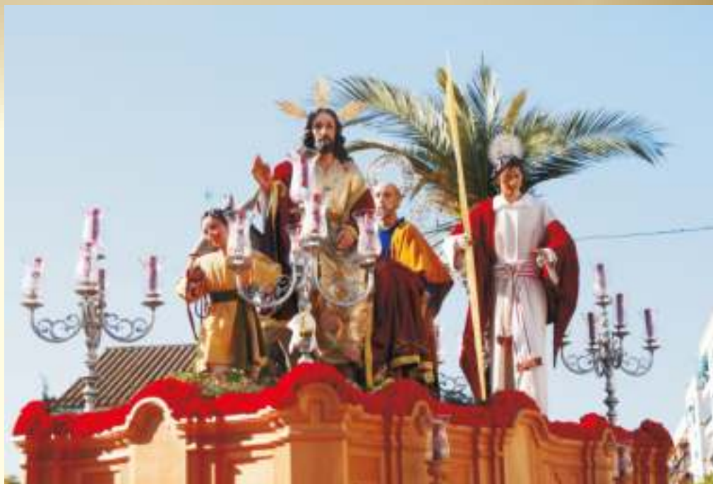
Misterio de la Entrada Triunfal de Cristo en Jerusalén

Mi vocación comienza el día en el que empiezo a dar catequesis de comunión en el colegio con un grupo de catequistas que ro-