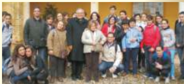
D. Demetrio Fernández, Obispo de Córdoba, con nuestros jóvenes en el Patio de los Naranjos

En una sociedad en la que se pretende eliminar a Dios del ámbito público vosotros lo hacéis presente de una manera plástica. Que en esos días, pues, preparéis vuestro corazón para vivirlos intensamente a través de los medios que la Iglesia nos ofrece y que no han pasado de moda: la oración, el silencio, el ayuno, la mortificación y la limosna. Pero sobre todo acudid al sacramento del perdón y al banquete de la Eucaristía. Ello nos llevará a tener un corazón caritativo con tantos hermanos nuestros que están pasando